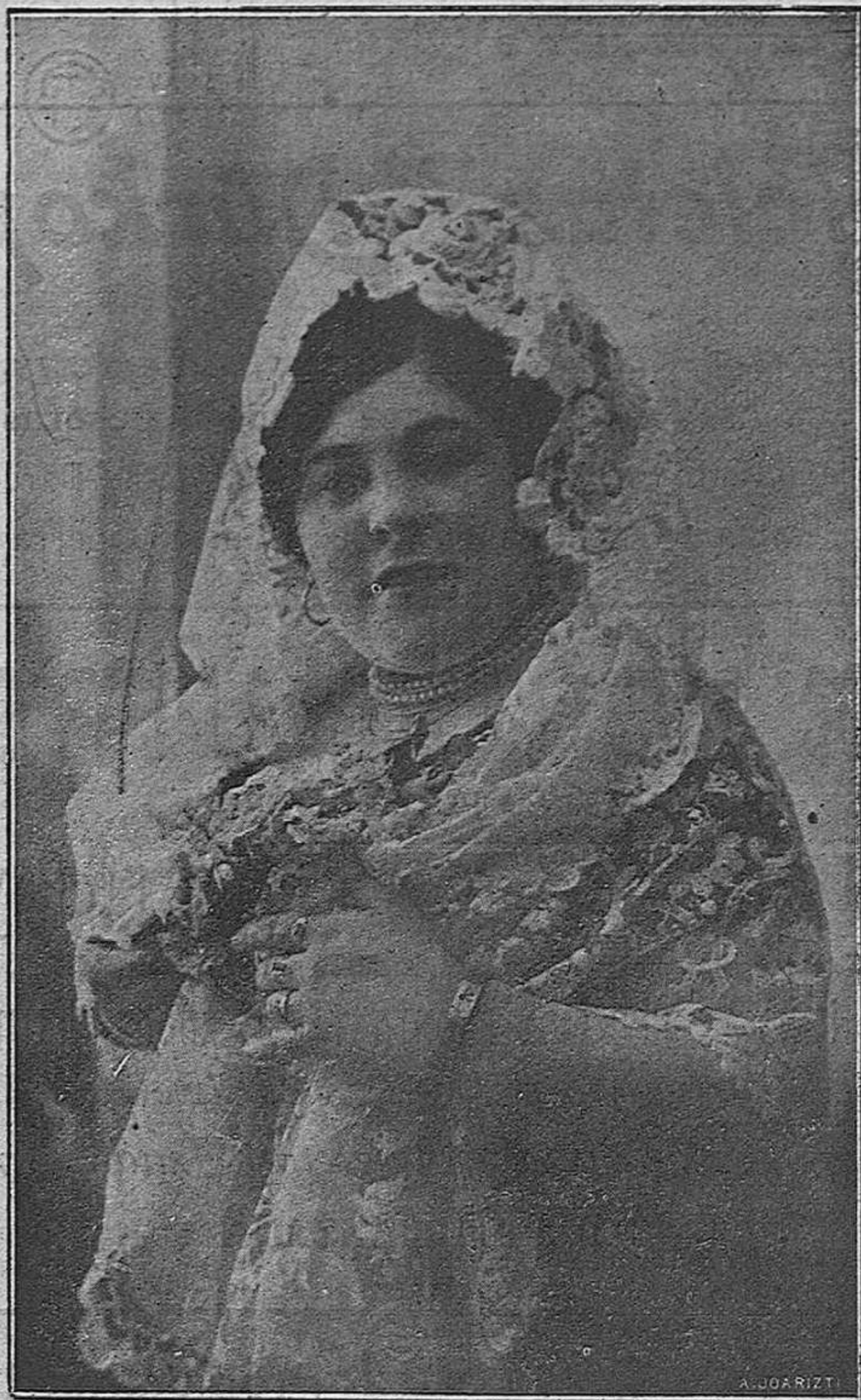
La notable artista de aires regionales, LA ESTRELLA DE LEVANTE