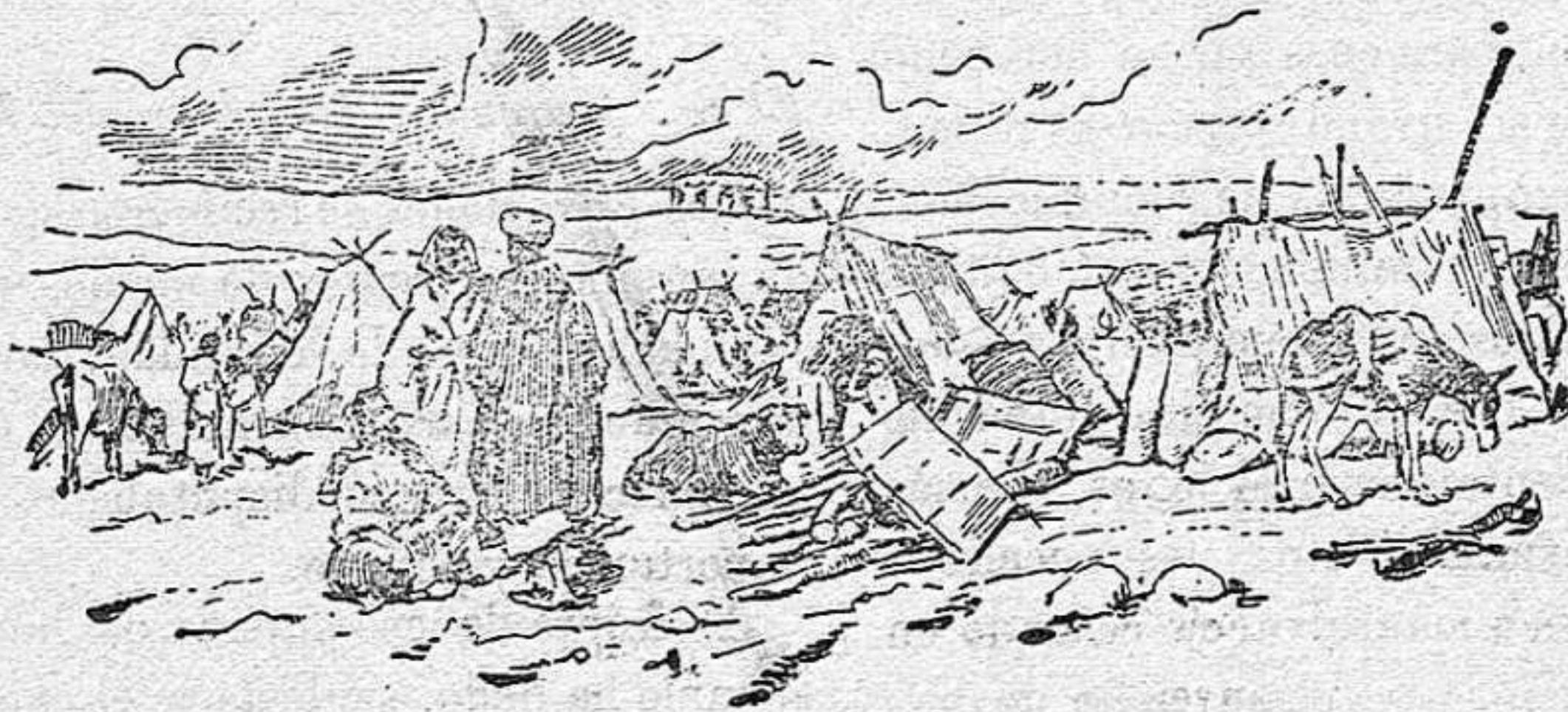
Campamento de moros sometidos en las proximidades del fuerte de Camellos.