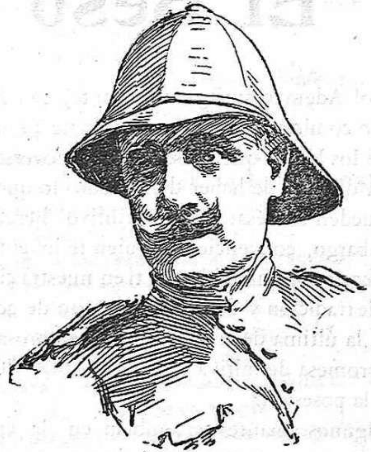
Coronel Gómez Jordana