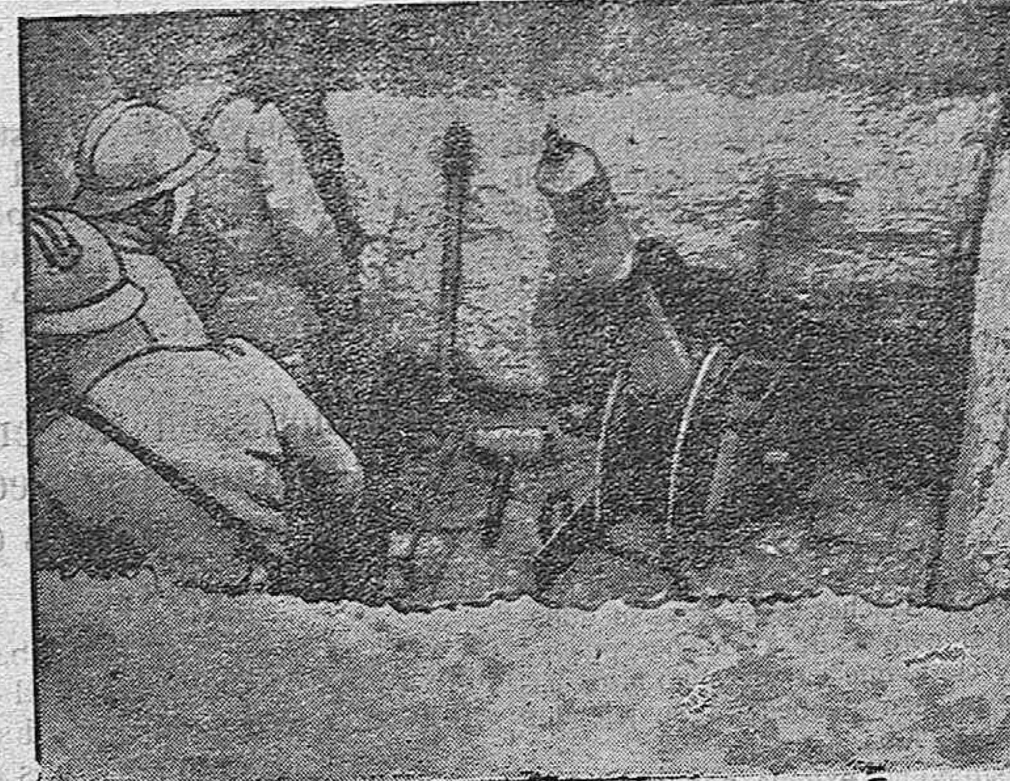
DE LA GUERRA.—Cañón francés de trinchera