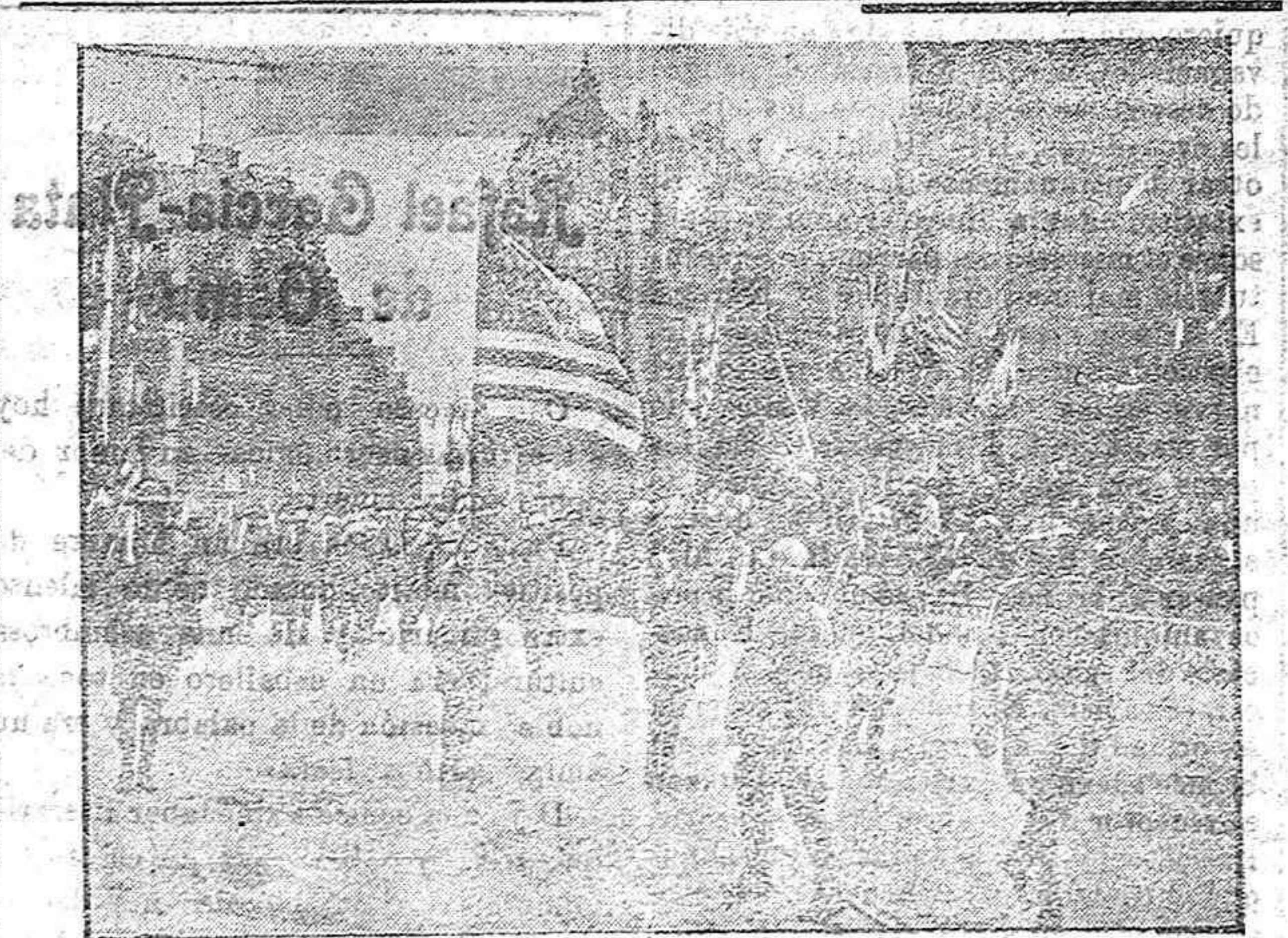
Desfile de tropas americanas en París.

Ya que por desgracia no estamos á la altura de nuestros antepasados ni