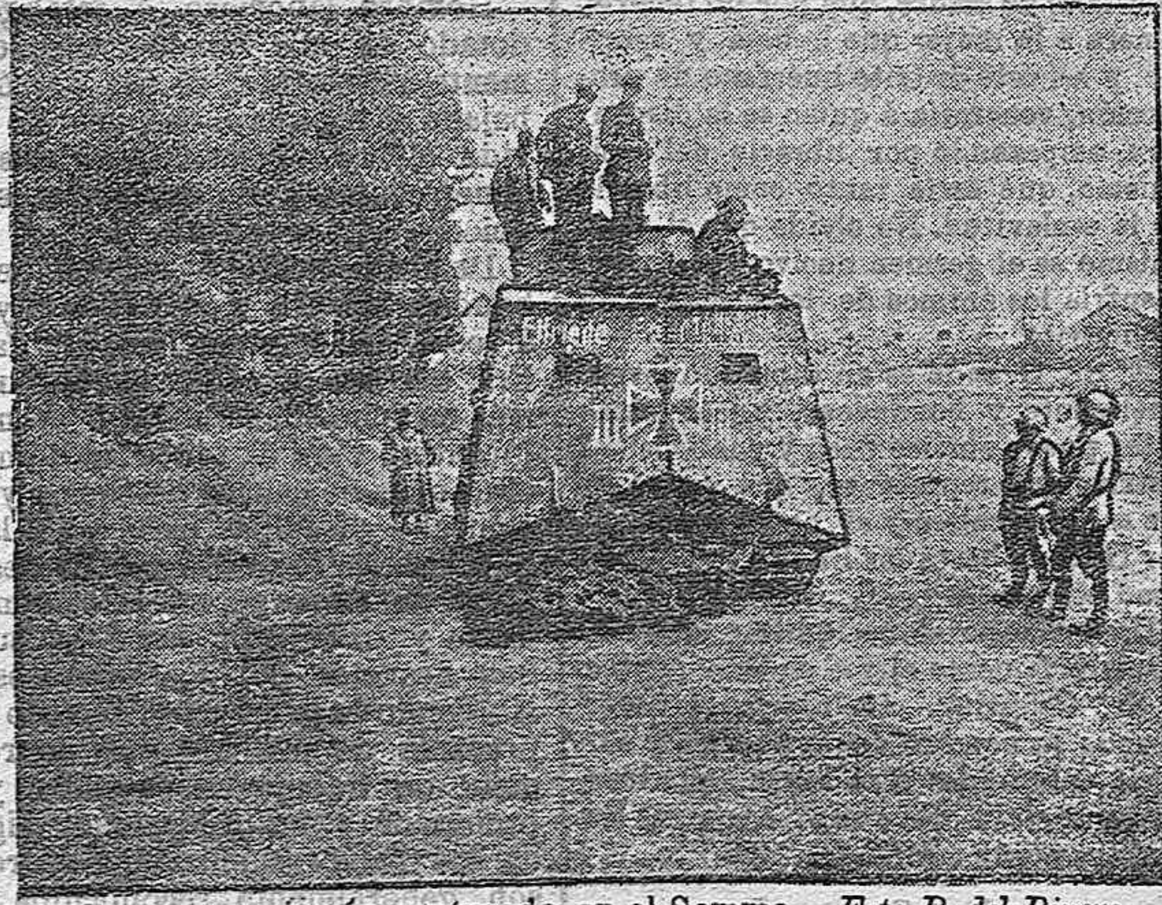
Un tanque alemán capturado en el Somme.