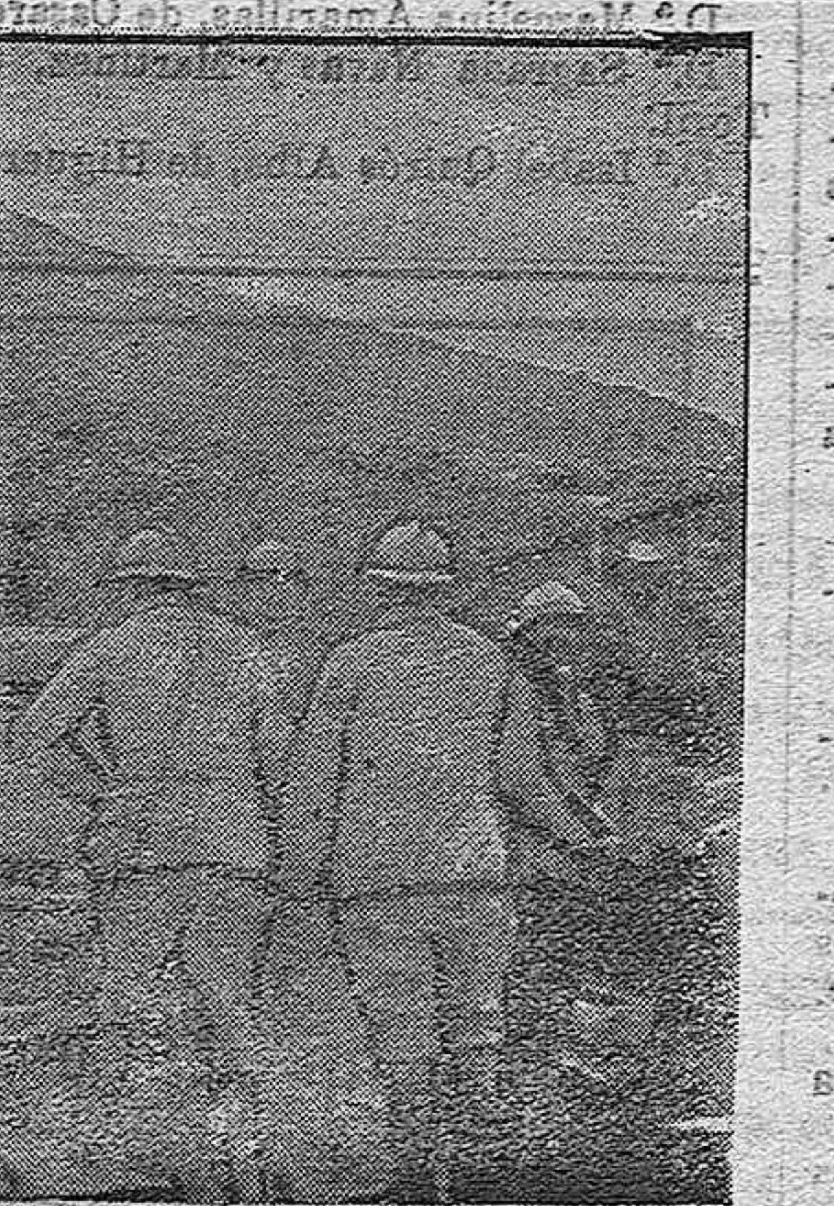
Un francés de 240, disparando.