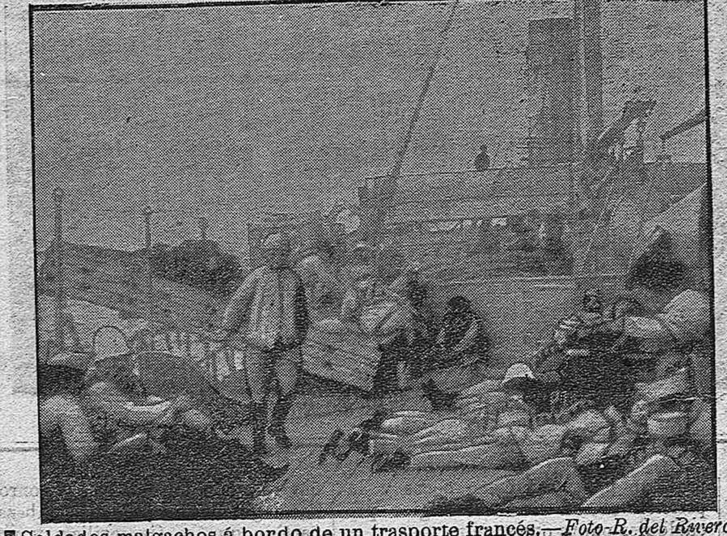
Soldados malgachos a bordo de un transporte francés.

Munich, 12 de Abril.—La «Gaceta» de Munich y Augsburgo publica un artículo del teniente Grantz, organizador de la Sociedad de Transportes por vía aérea, que se ha constituido recientemente en Munich. Una declaración de esta Sociedad dice así: Nos proponemos un doble fin; de una parte la transmisión de cartas y paquetes postales (no será necesario recurrir a tasas suplementarias para el transporte de cartas), y de otra parte el transporte de viajeros, que no será más costoso que el transporte en automóvil antes de la guerra. Un solo avión de grandes dimensiones, capaz de transportar 45 a 50 personas, estará en situación de sostener la competencia de los caminos de hierro. El precio del billete para el trayecto Hamburgo-Constantinopla será de 400 marcos, precio inferior al del billete de primera clase en el expreso de los balcanes. Se efectuará en 20 horas con 6 paradas, el trayecto que recorre el tren en 70.