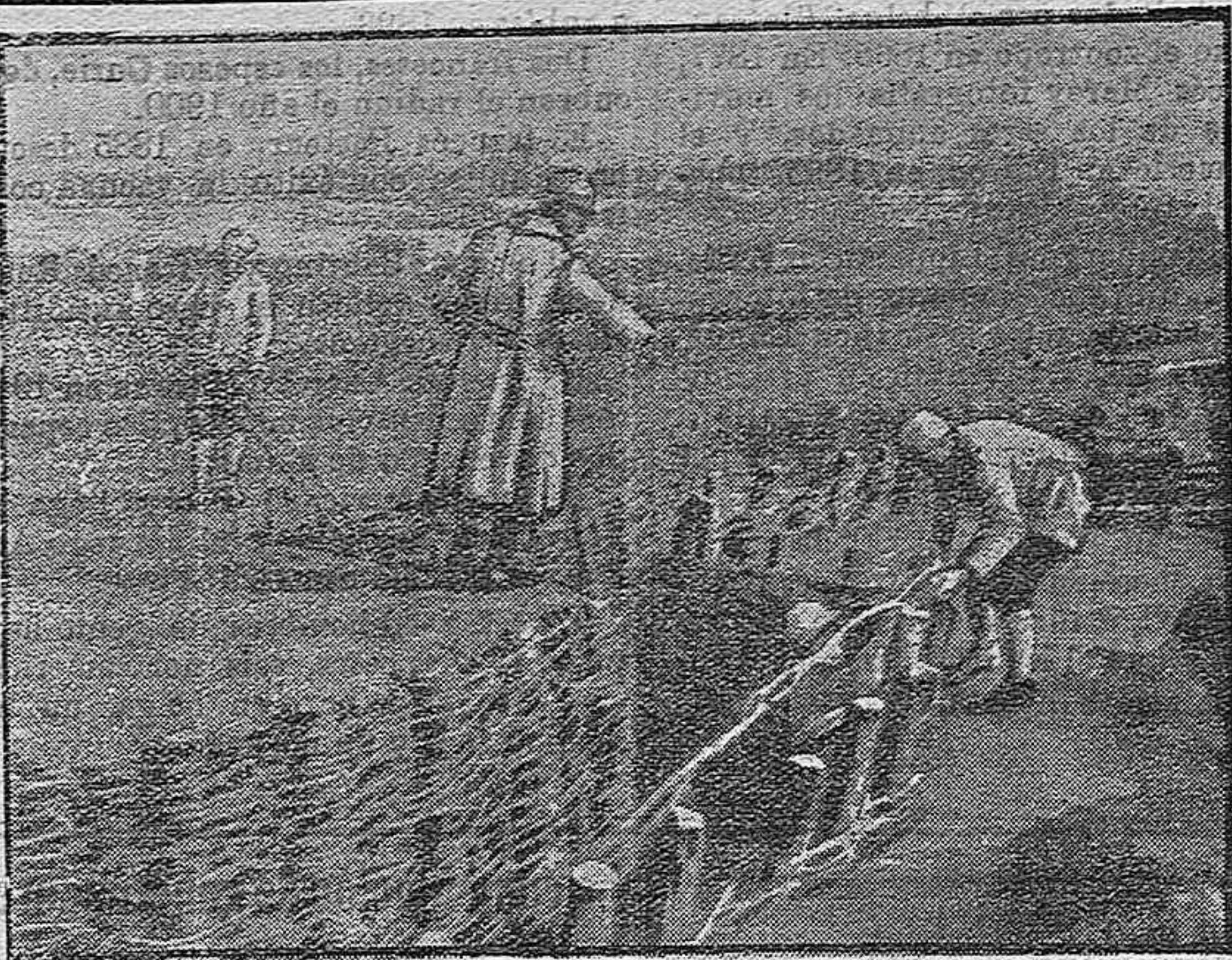
Construcción de trincheras en el frente francés.

La Comisión visitó también al señor Subsecretario de Hacienda, el cual, haciéndose igualmente cargo de la actual situación, prometió activar los trámites para la concesión del crédito pedido.