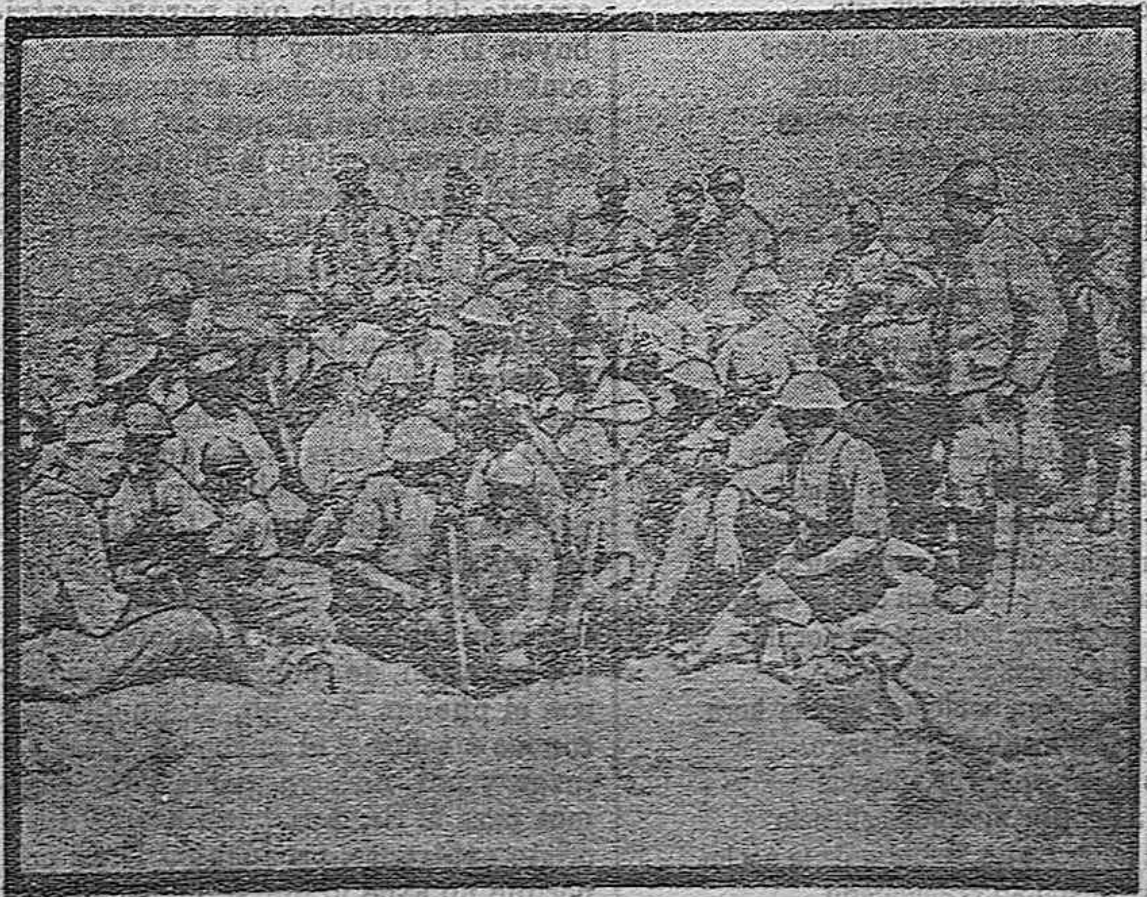
Soldados franco-ingleses fraternizando en terreno conquistado

Su actuación parlamentaria en las actuales Cortes ha sido también muy brillante.