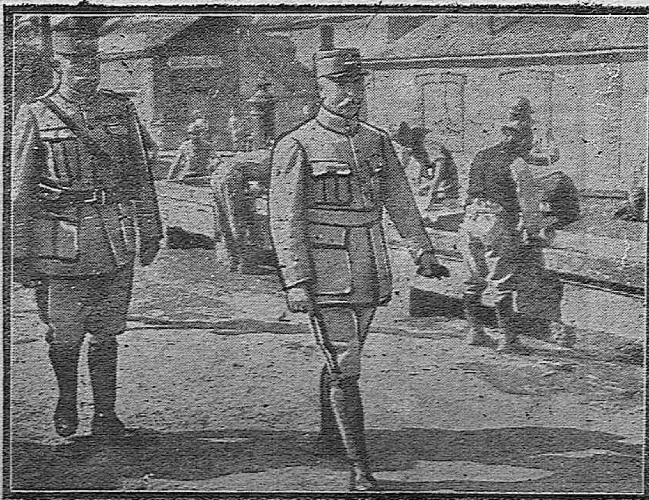
El general Petain recomiendo un centenario...

Habiendo terminado el plazo de un mes que se concedió a los agricultores para formular propuestas sobre cultivo del tabaco y siendo muy pocas las peticiones recibidas, se ha ampliado hasta el 30 de Septiembre los plazos señala-