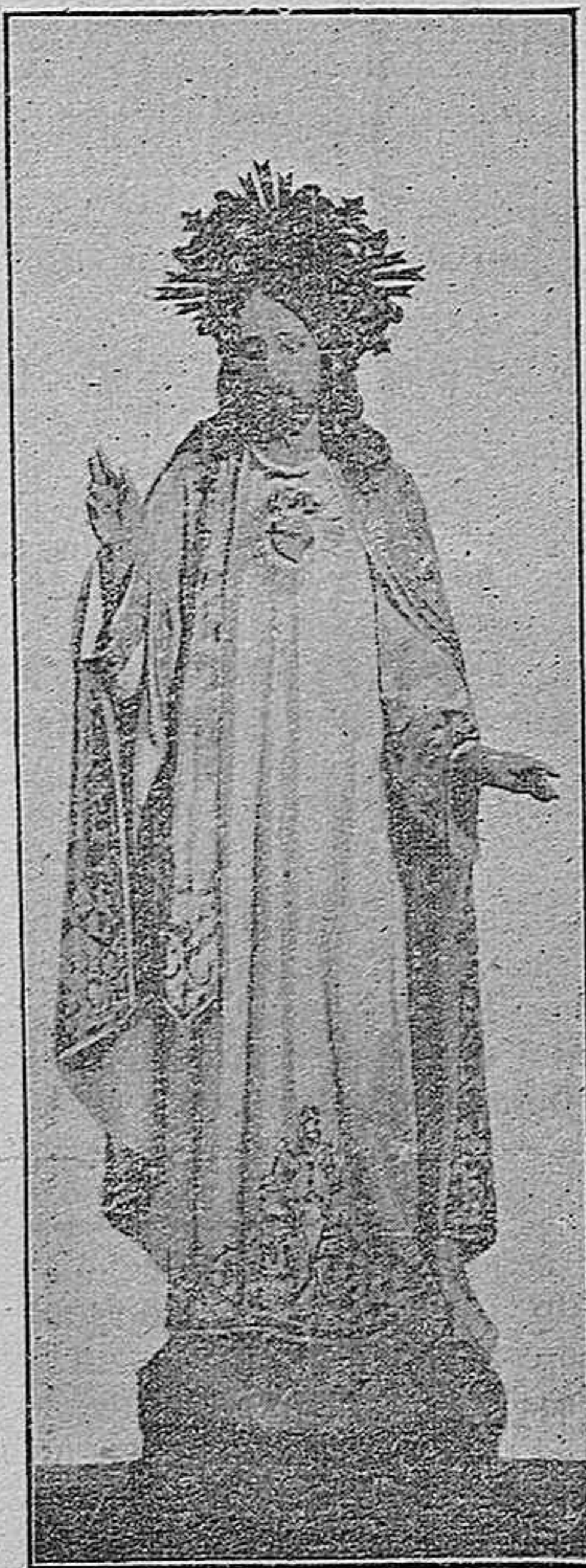
Nueva Imagen del Sagrado Corazón de Jesús (Parroquia de San Mateo. Cáceres)

porque la experiencia nos ha demostrado que algunas veces un solo detalle hace variar por completo y descompone el conjunto; pero tengan la seguridad algunos impacientes, si los hay, que si los feligreses nos ayudan, como hasta el presente, no ha de ser nota discordante la ornamentación de la suntuosidad del Templo.