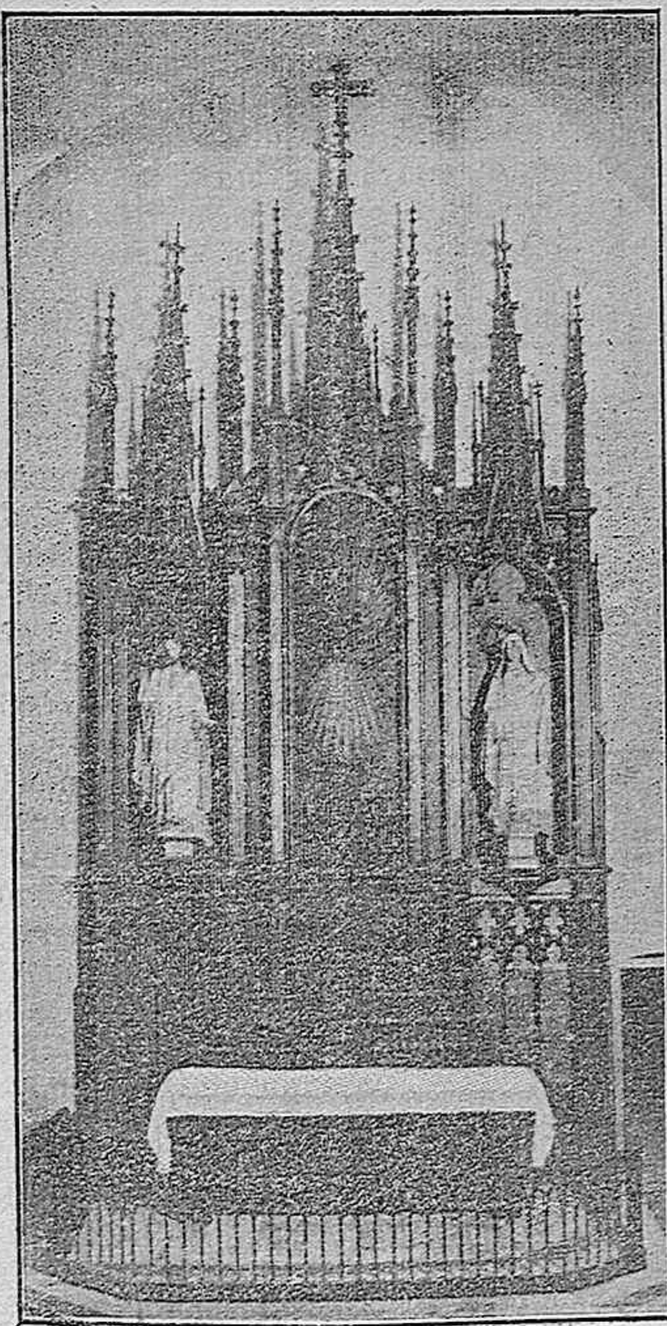
Nuevo Altar del Comulgatorio, Parroquia de San Mateo (Cáceres)

Es una de las obras maestras, que pone al Sr. Marqués á la altura de los más afamados escultores españoles, que será admirada