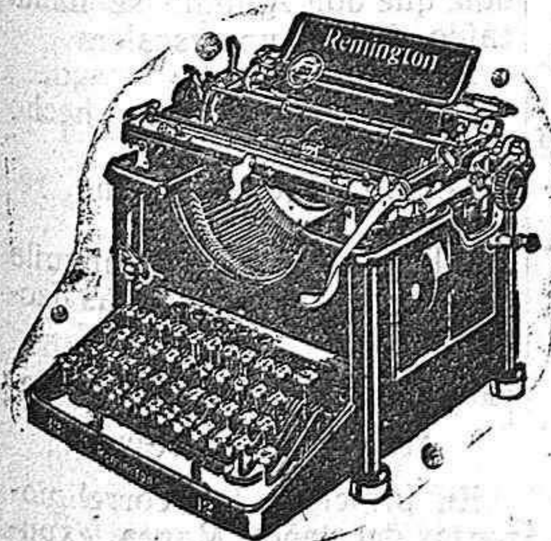
Máquina de funcionamiento silencioso

EN LOS 52 AÑOS QUE LLEVA DE PRÓSPERA EXISTENCIA LA CASA