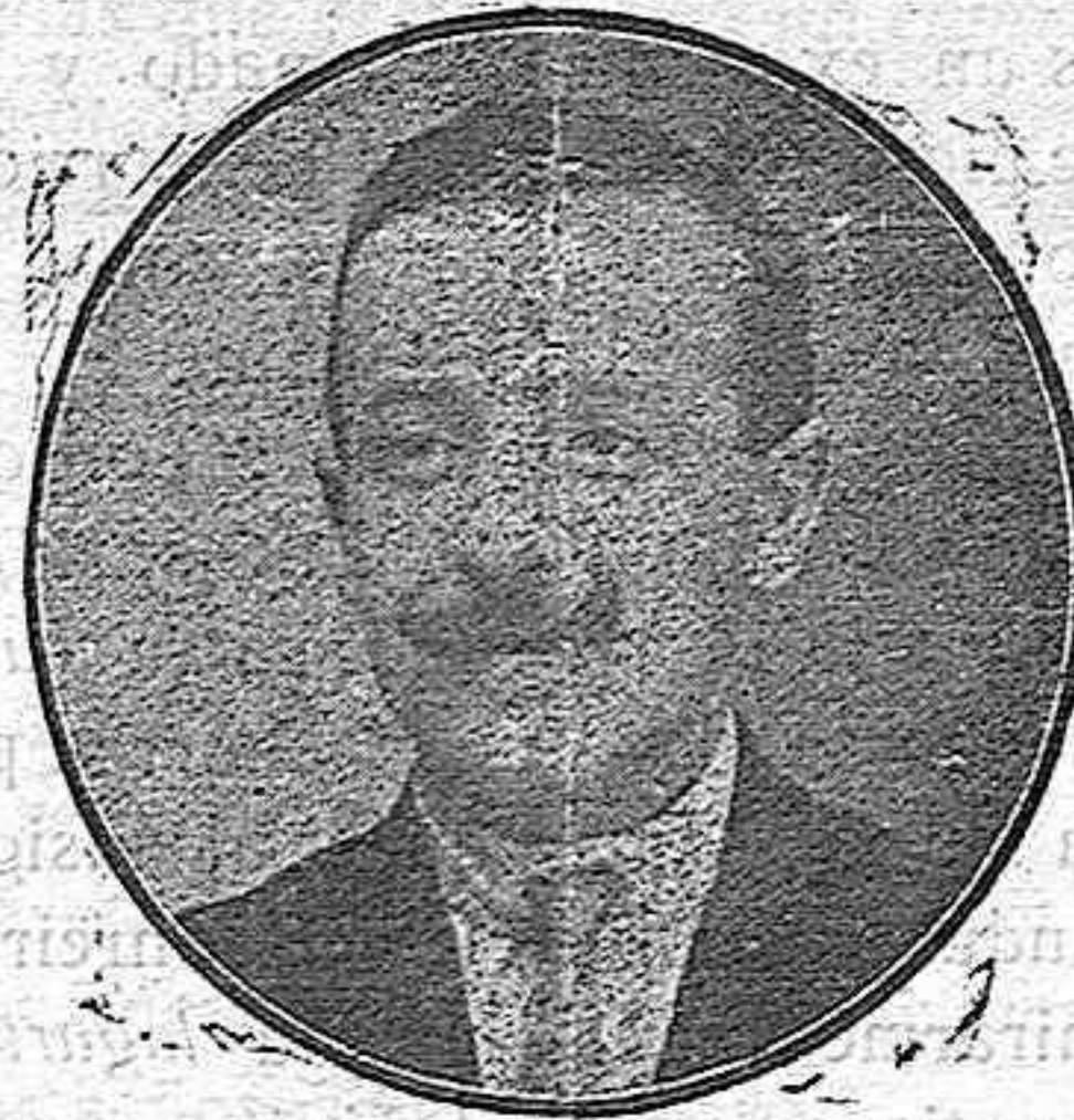
EL GATO MÁS NEGRO DE NUESTRA GATERA

Da una idea bien clara de lo escaso que estaremos del líquido elemento que, al saber tocábamos a 3 litros, nos pusimos más contentos que chiquillos con zapatos nuevos. Para mayor comodidad y quizás pensando en que con esto estaba ya resuelto el problema, y desistir en absoluto de las de Montánchez, que es caudal abundante ya que saldríamos a más de 100 litros por habitante, se pensó elevar el agua a un montecito próximo a la población, construyendo en él un depósito, para que desde allí, por su propio impulso viniera el agua a ésta.