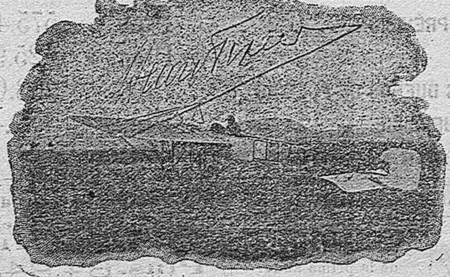
El Aviator Cizier disponiéndose á emprender uno de sus vuelos.

el 31, mañana y tarde, con vuelos de altura y distancia en el Aeródromo, por el Aviator (Piloto A.E. C.F.) Enri Cizier , el que manejará un monoplano Bleriot-Gnome 50 H. P. (Record de duración en Milán el 3 de Julio de 1911. Record de distancia y vuelo sobre Milán el 7 de dicho mes y año, ganando todos los premios. Vuelo de altura sobre Turin, Septiembre 1911).