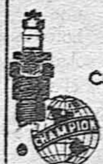
CHAMPION SPARK PLUG CO TOLEDO OHIO U.S.A.