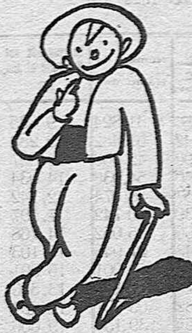
¿Pide agua?—es un de- cí—pós se le da vino. ¿Pi- de vino...?