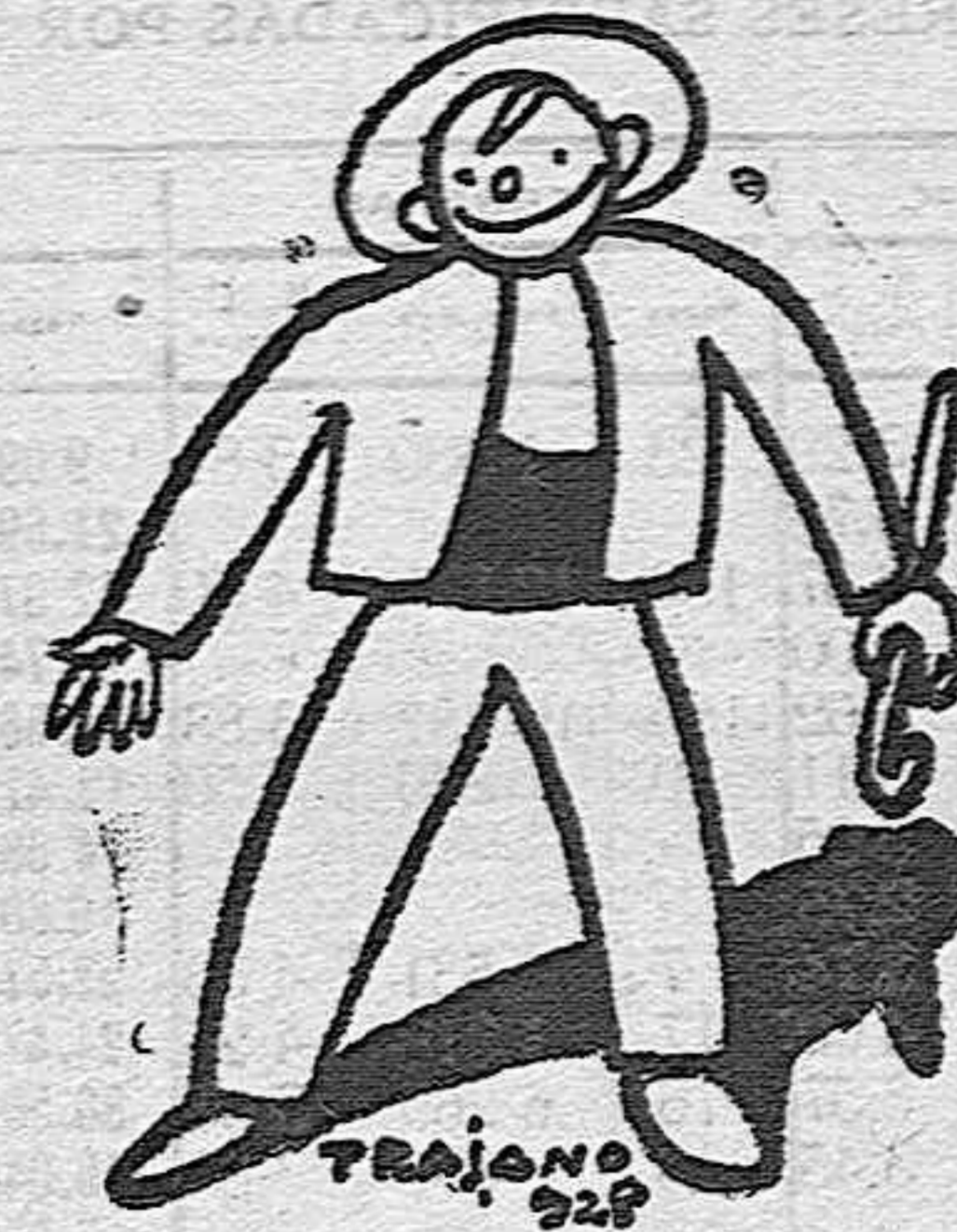
TRAJANO 92P Claro es, que si pide vi- no... pos se le da hasta jar- tarlo, porque no siempre se le va a llevar la contraria...