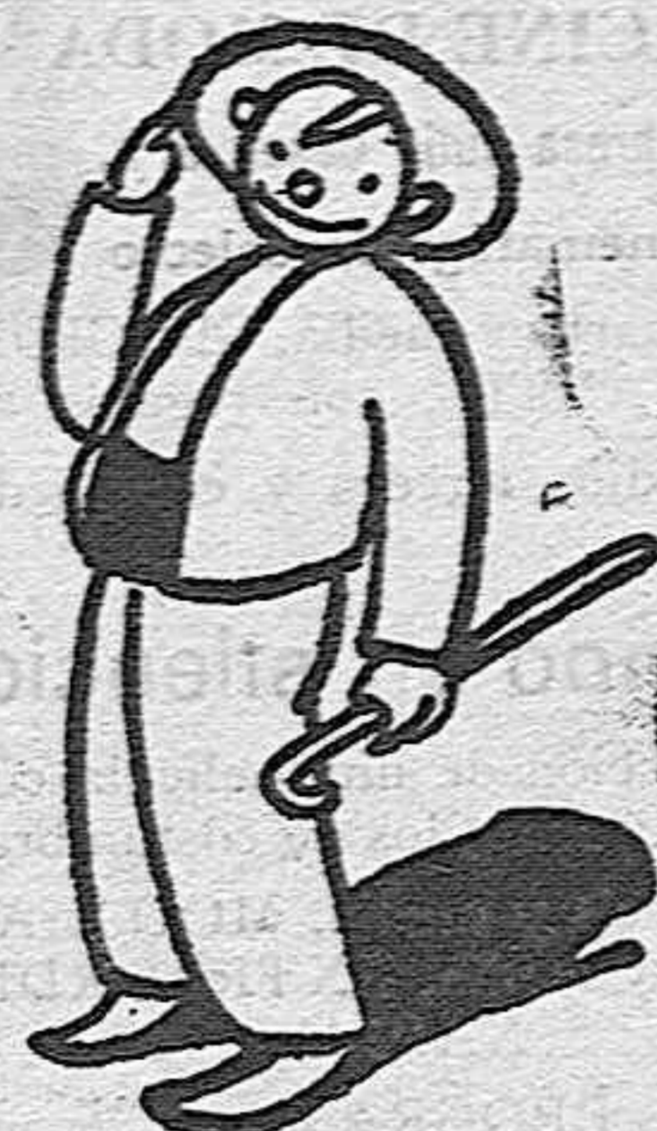
Al cuerpo hay que darle, "pa que ande" bueno, lo contrario de lo que pida.

CUPÓN VOTO Concurso de belleza infantil de CORREO EXTREMEÑO Voto por el niño cuyo retrato publicado en las páginas del Concurso figura con el Núm. _____ D _____