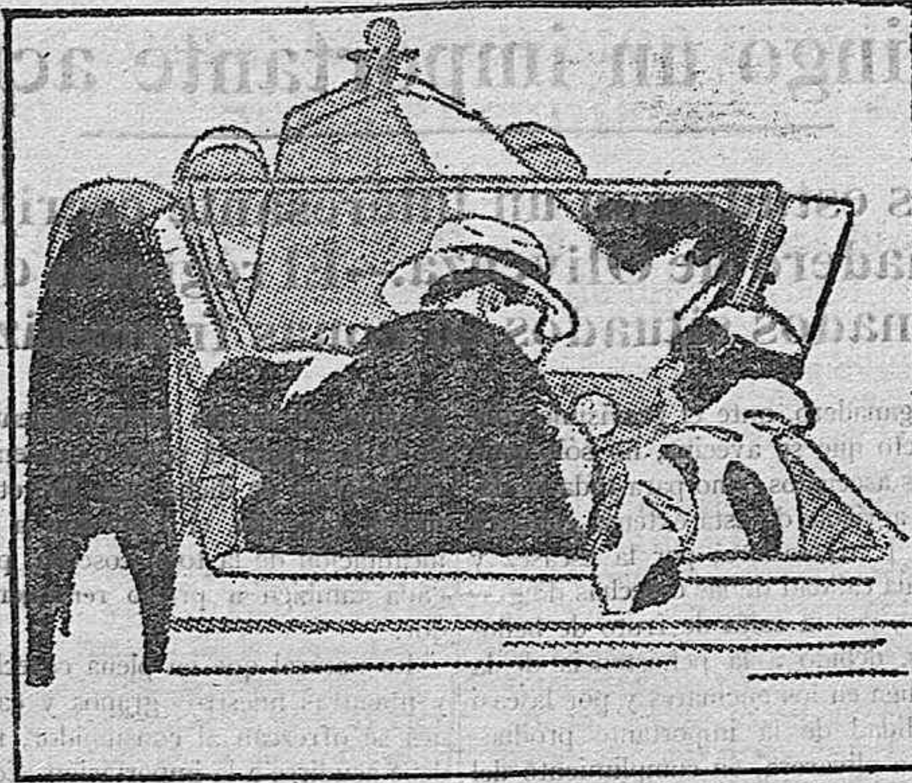
Algo pasa. El cambio de marchas no funciona. Esto no es la palanca de velocidades, Jaime; es mi rodilla.