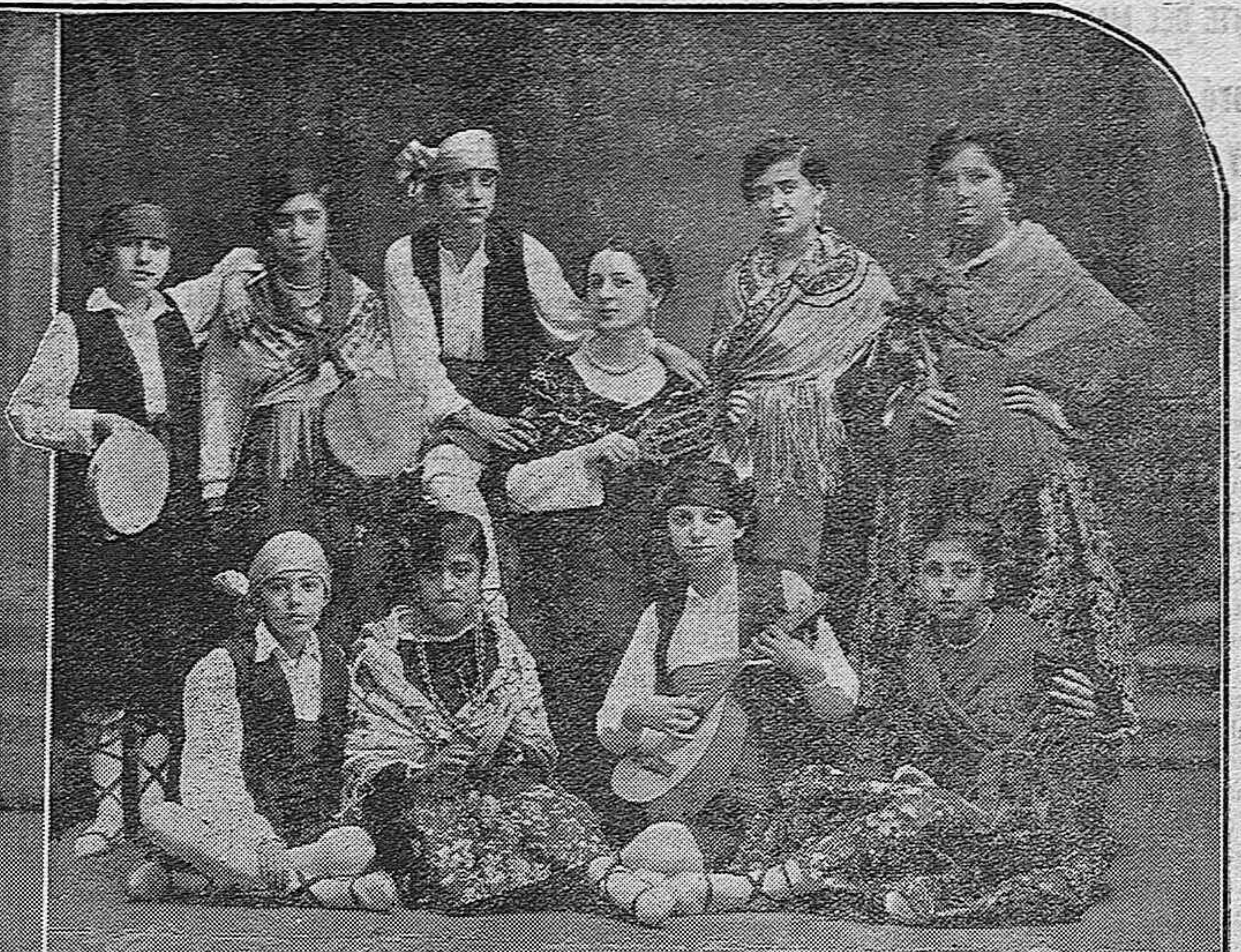
Rondalla aragonesa que tomó parte en el pasado festival infantil celebrado en López de Ayala