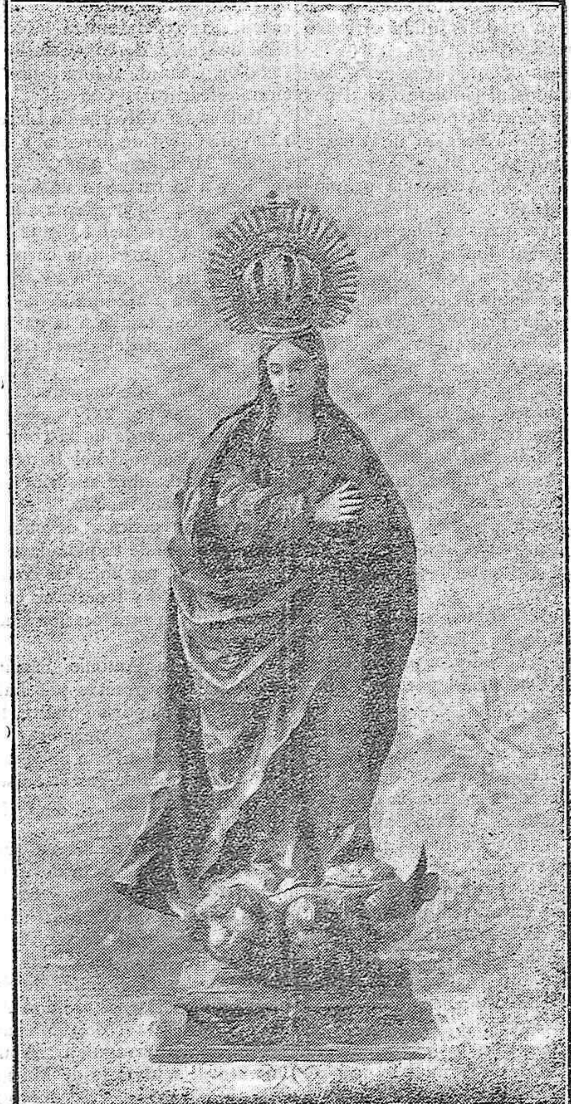
Admirable talla de la Inmaculada Concepción, una de las más artísticas que nos legó la España Concepcionista y que se venera en el altar mayor de este templo parroquial.

Extremadura. Vos, que sabéis mi valer y mi amor a los hombres, direis si me quejo razonadamente. Soy el más rico, el más fecundo de los dones divinos; soy la abundancia y el bienestar del pobre. La Madre Extremadura tiene hijos innumeros que no pueden trabajar las tierras de secano, tiene otros muchos que ignoran la riqueza que yo puedo otorgarles. ¡Señor! Mansamente vengo deslizándome por la Serena, por la vega de Mérida hasta llegar a Portugal, despreciado, olvidado, desconocido. Algunas veces pensé levantar la cabeza antes de ahora, como viera un poeta a mi hermano el Tajo, para predecir ruinas y calamidades sobre el pueblo ingrato. Pero oí mi nombre en la lobreguez de mi lecho y esperé, cuando anunciaban que mis aguas fueran rápidas a un pantano que llaman Cijara: vi entonces a los obreros que, mustios, se arremolinan en las plazas, correr hacia las vegas de regadío para trabajar la tierra rica. Pero... ¡Señor! sois el primero que venís a anunciar mi valer y mi fecundidad. Hasta tanto que lave y riegue los campos, seré el mejor amigo, la principal fuerza de esta fábrica monumental que llamais Matadero e inicia una época de prestigio y grandeza en el suelo que estais pisando. Y la multitud y el Rey aplaudieron frenéticos. Y vi a lo largo de los años que el río se deshacía en canales y en acequias y no perdía su caudal y la tierra parda y la tierra honda y entrañable fructificaba pujante y la paz crecía en los espiritus y Dios estaba con los hombres... R.