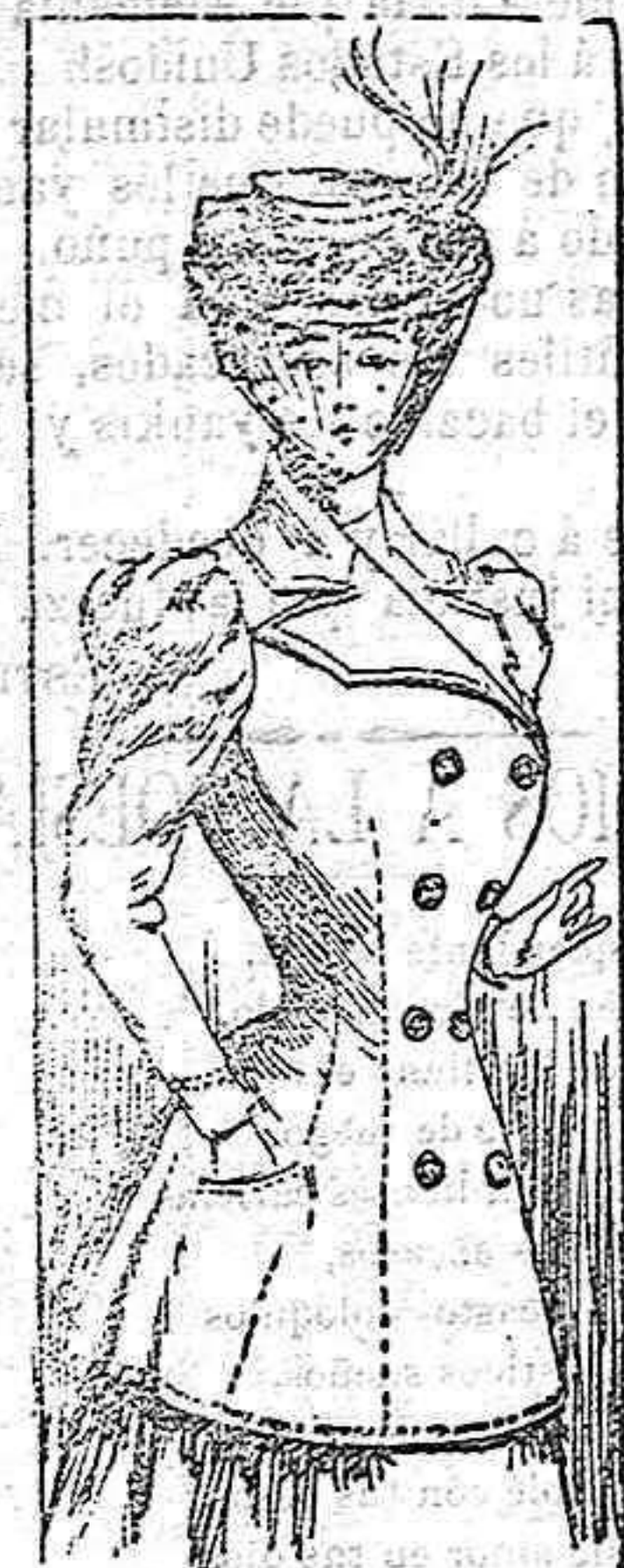
Chaqueta para invierno.

Se confecciona este traje con pañet dama. Lleva el cuerpo abierto sobre un peto bordado en seda y patas de terciopelo verde á los lados. Cuello alto bordado sobre un fondo de terciopelo y mangas estrechas con berthas de terciopelo y pañete. Cinturón de terciopelo y falda abierta en el delantero, sobre una quilla de bordado.