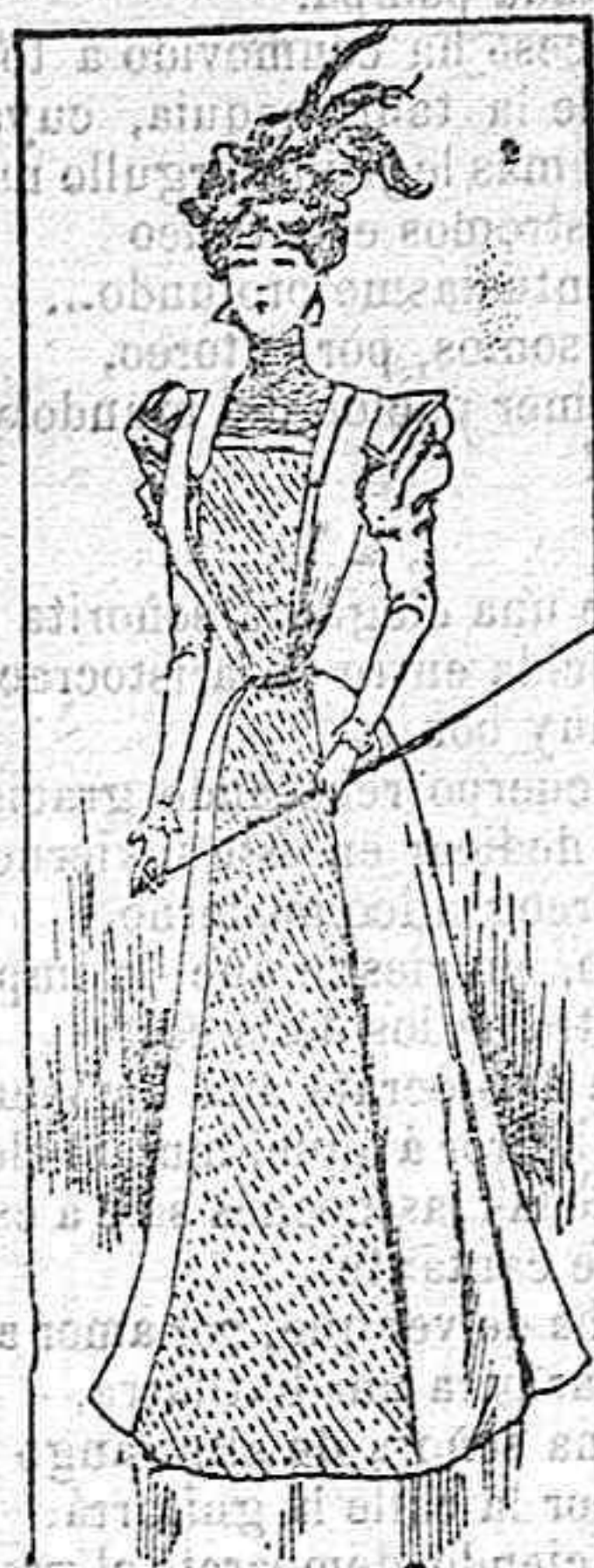
Traje para paseo.

Modelos exclusivos para nuestras lectoras, de los almacenes de EL SIGLO, Barcelona (1).