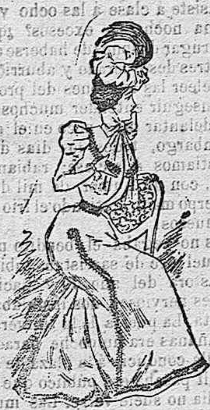
Traje para paseo.

Modelos exclusivos para nuestras lectoras, de los grandes almacenes de EL SIGLO, Barcelona (1).