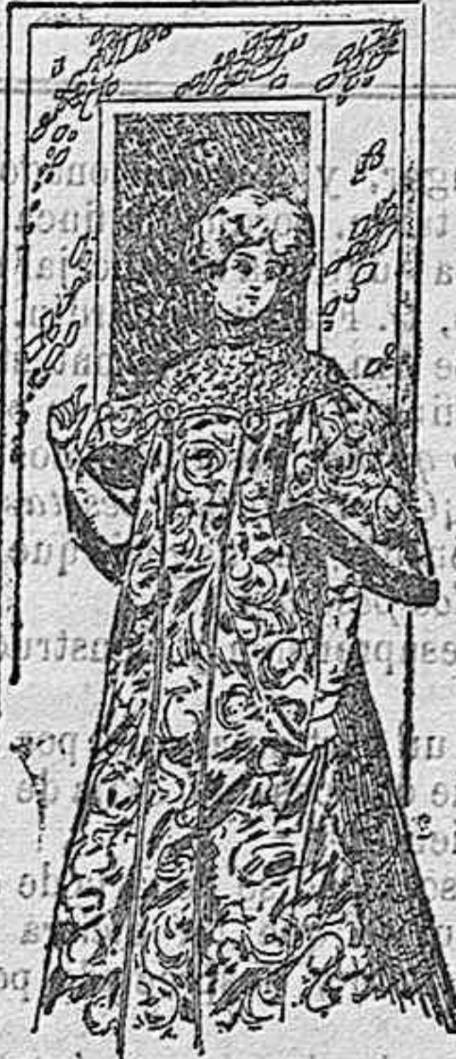
Traje para recepción.

Modelos exclusivos para nuestras lectoras, de los grandes almacenes de EL SIGLO, Barcelona (U.).