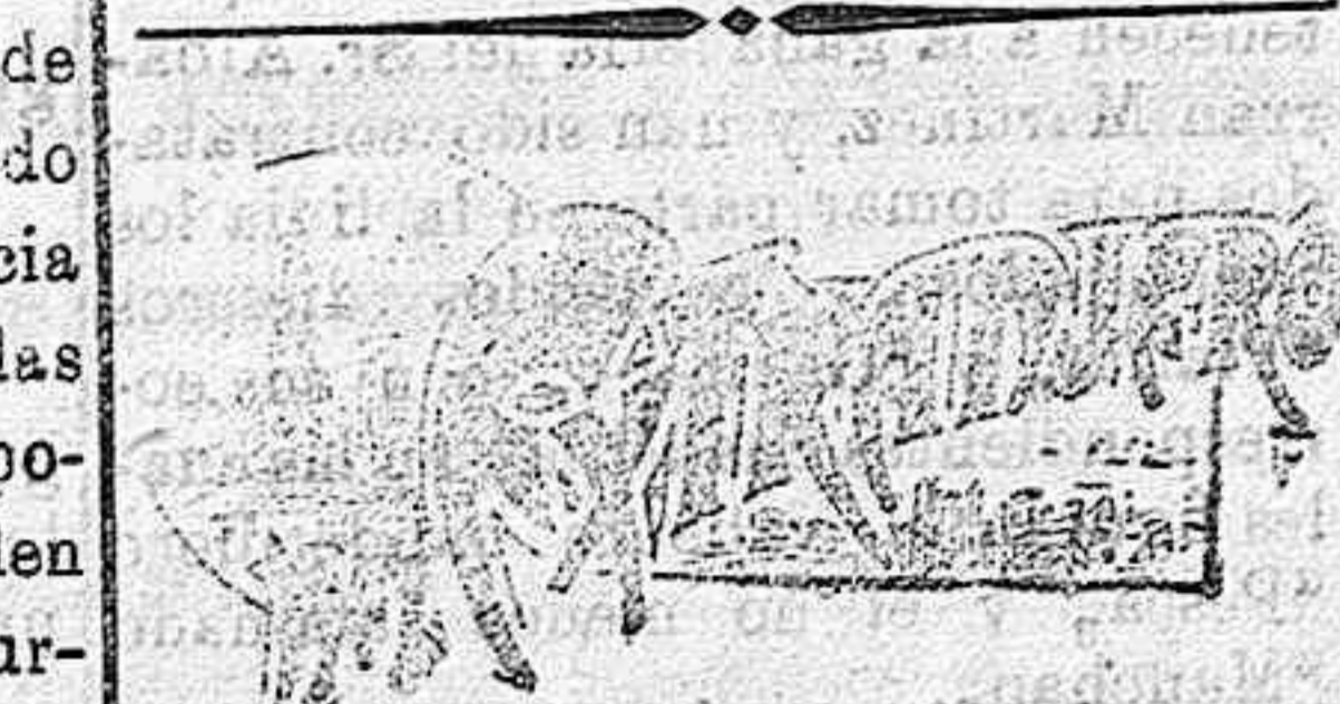
(DE NUESTRO SERVICIO ESPECIAL)

Desórdenes y huelgas.—Matanza de Judíos.—Reformas agrarias.—Suspensión ó disolución de la Duma.—Planes del gobierno.