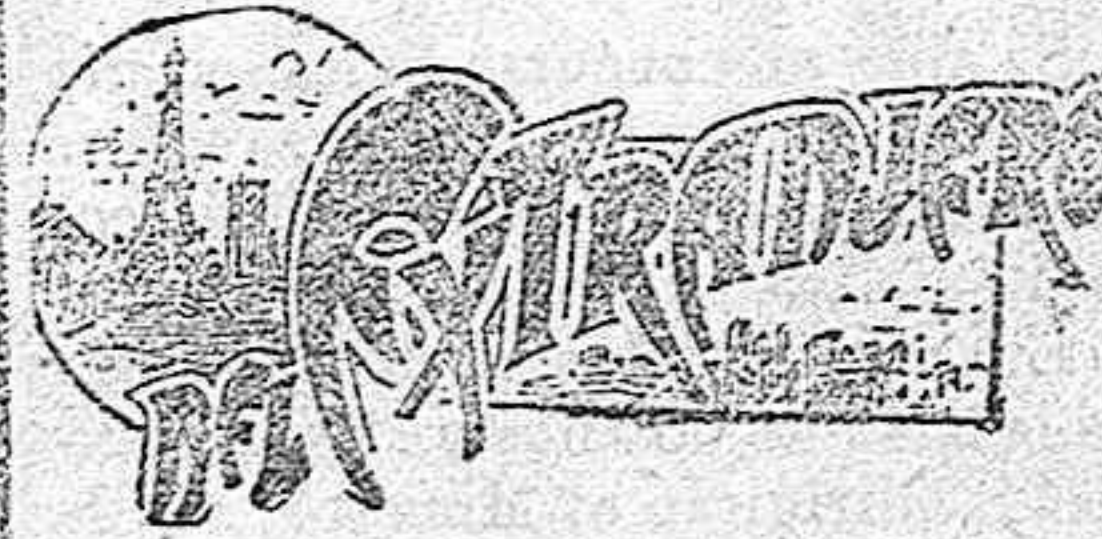
(DE NUESTRO SERVICIO ESPECIAL.)