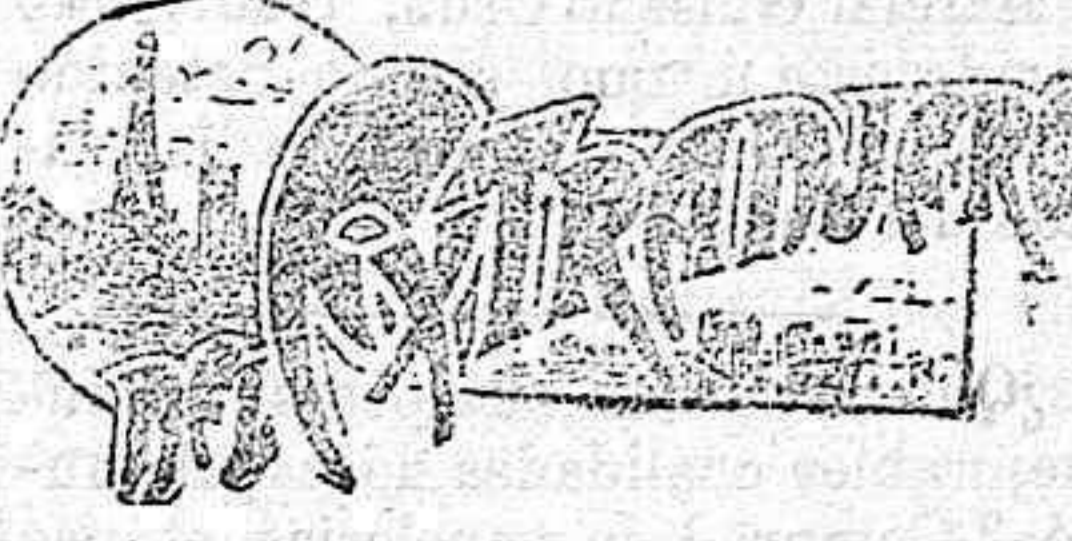
(DE NUESTRO SERVICIO ESPECIAL).

Huelga de jardineros.—Escasez de flores, frutos y hortalizas.—Obreros y patronos.—Manifestaciones.