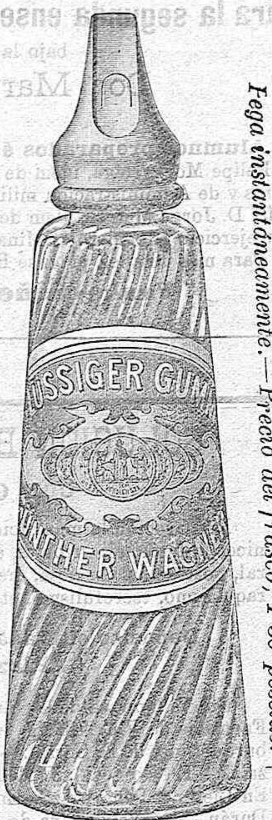
Es la mejor goma para escritorio.