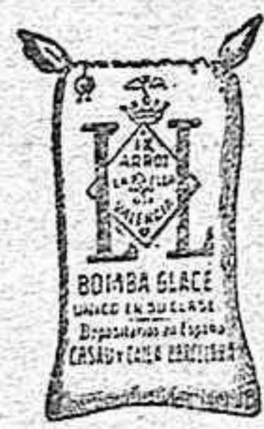
Arroz Glacé (1 Kilo)