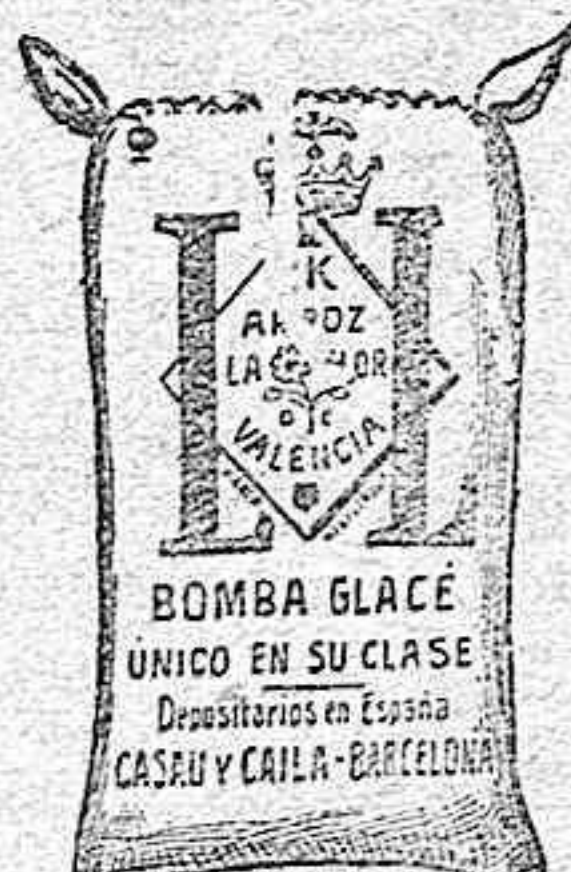
Arroz Glacé (2 Kilos)