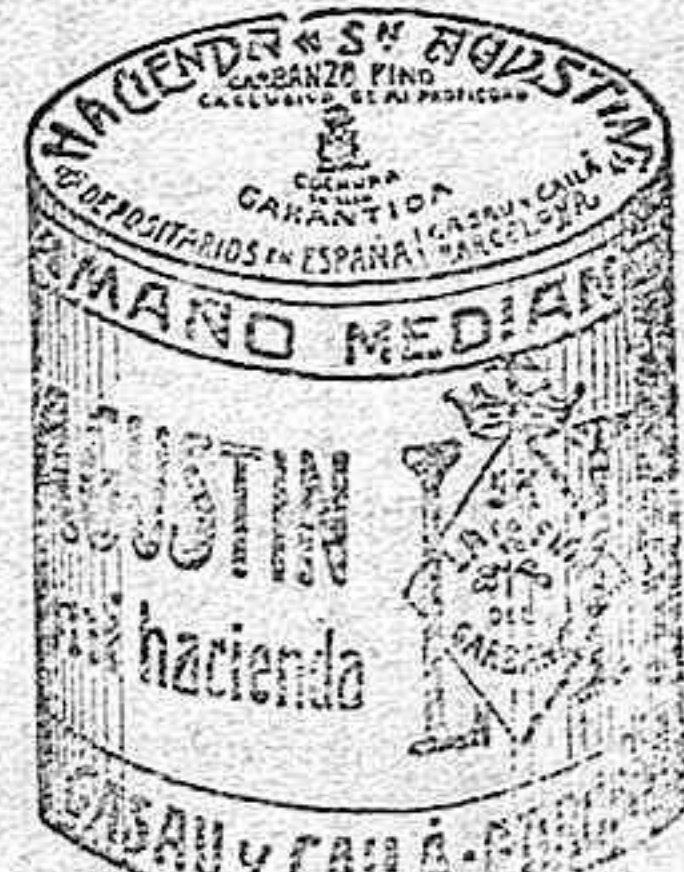
Garbanzo Sauco (5 Kilos)

Garantizamos al público que los comestibles empaquetados con nuestra marca son naturales de la planta, y sin contener la más pequeña adulteración en beneficio de ellos ni para hermostrarlos, por lo cual nos hacemos responsables á todo análisis que quiera efectuarse.