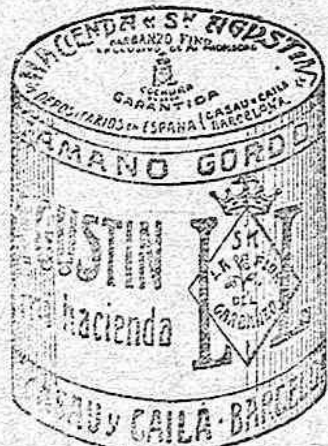
Garbanzo Sauco (5 Kilos)

Bastan tres fricciones para hacerla desaparecer por completo. Éxito garantizado. No huele, ni mancha. Eficaz en toda clase de granos Pesetas 1'50 y 2 por correo.—DEPÓSITO: En Castuera en casa del autor A. Camacho.—Badajoz, Navarro, De Gabriel, 4.—Mérida: A. Rubio.—Madrid, Martín y Durán.