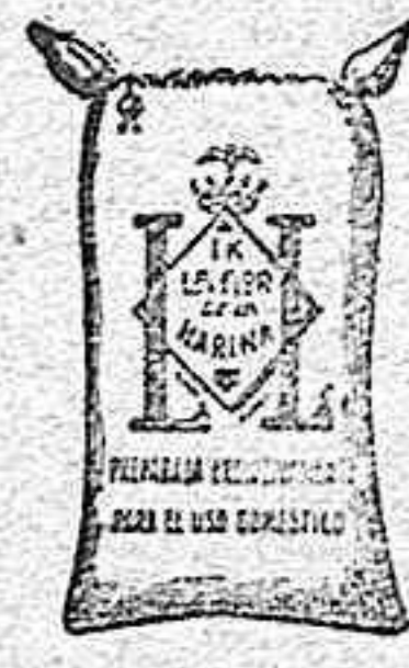
Harina Frappé (1 Kilo)