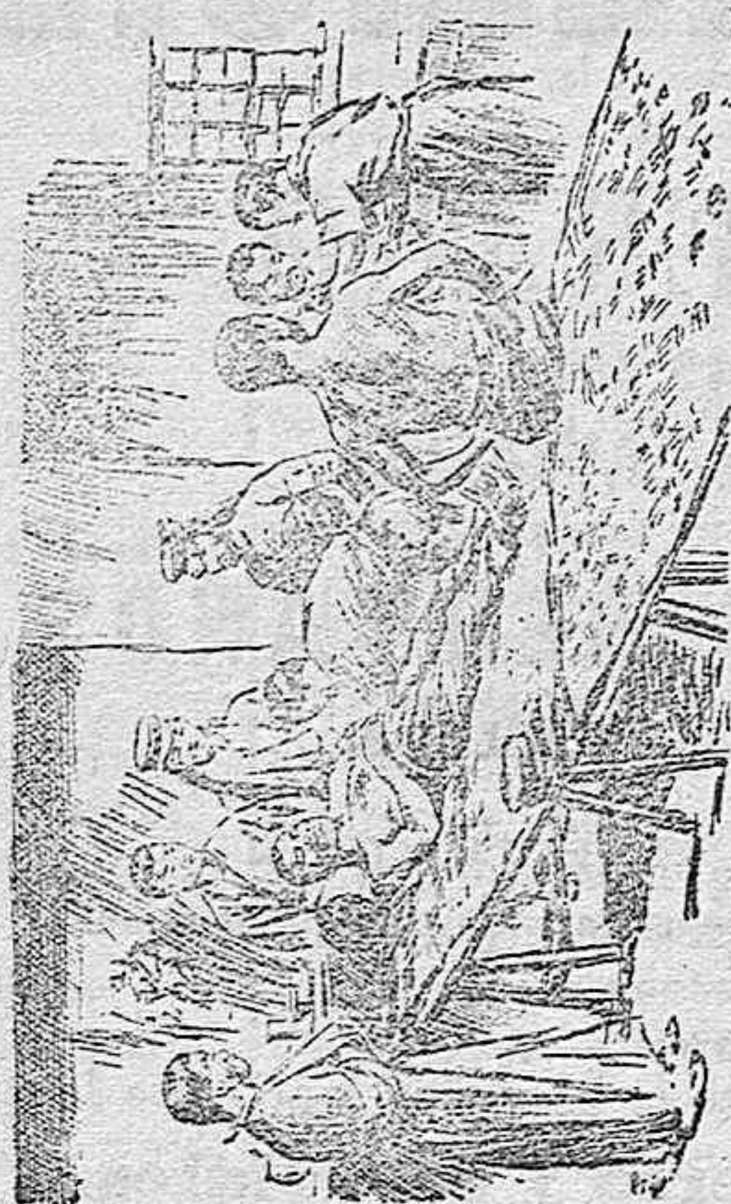
Cirujanos japoneses operando a los heridos en un hospital de sangre.