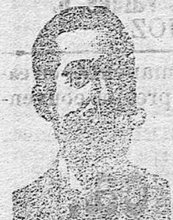
Inventor de los renombrados medicamentos COSTANZI Diputación, 435, Ierna.

Roob antisifilítico Inyección Vegetal COSTANZI