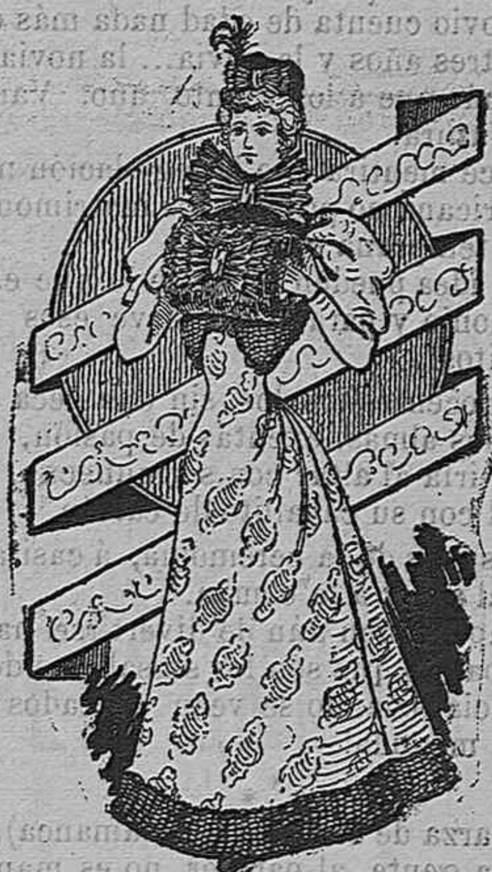
Traje para visita.

Modelos exclusivos para nuestras lectoras, de los grandes almacenes de EL SIGLO, Barcelona (1).