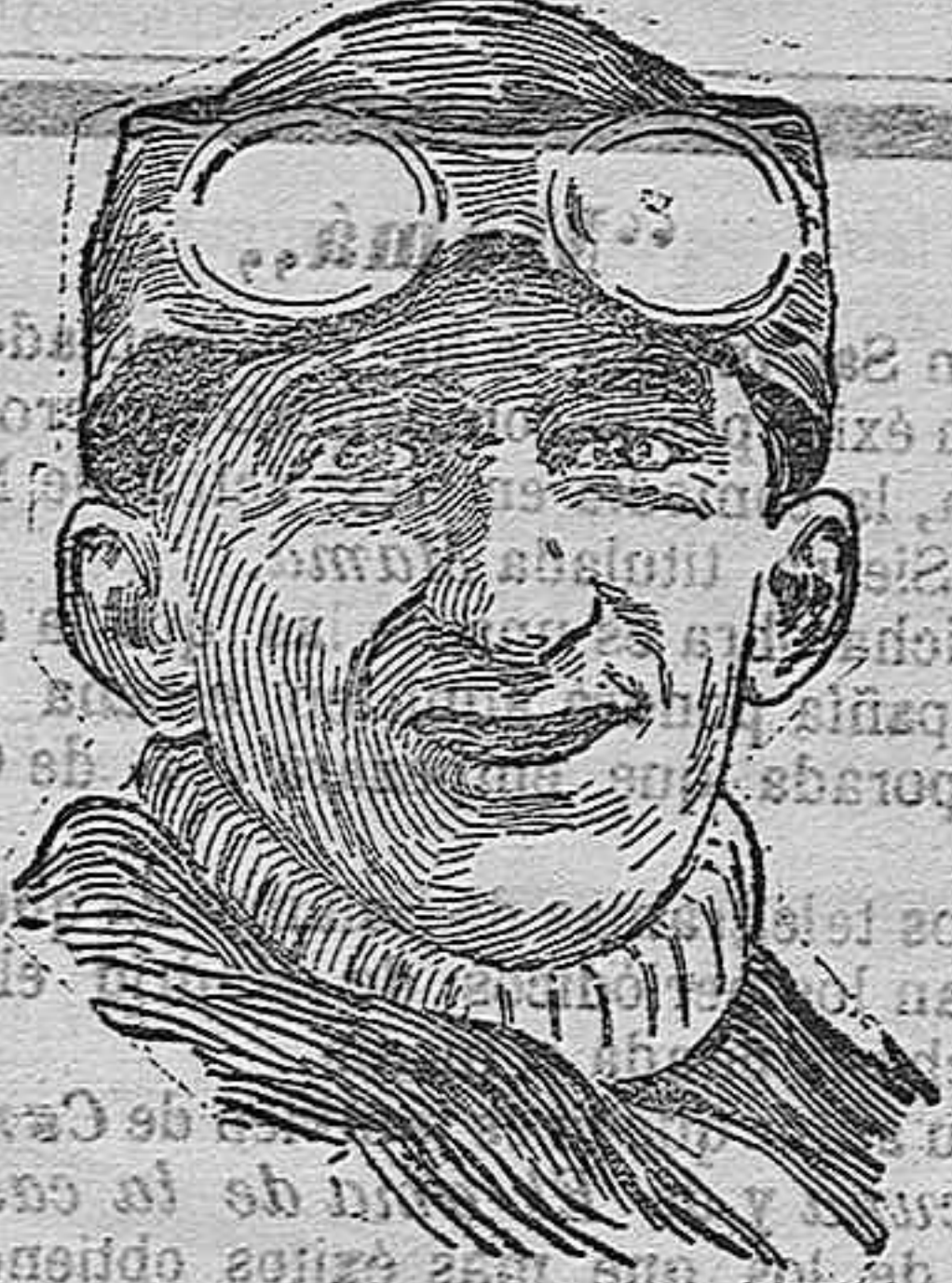
El aviador Legagneux

Hace poco más de quince días, Garros, el simpático aviador que tantos admiradores tiene en España, asombró al mundo alcanzando con su aeroplano los 5.200 metros de altura; la exclamación de asombro fué general, y el intrépido francés vióse proclamado recordman de altura. Poco tiempo le ha pertenecido ese record ; otro aviador no menos famoso que él, é igualmente como él aplaudido en España, le ha superado en tan singular hazaña, elevándose á 5.720 metros.