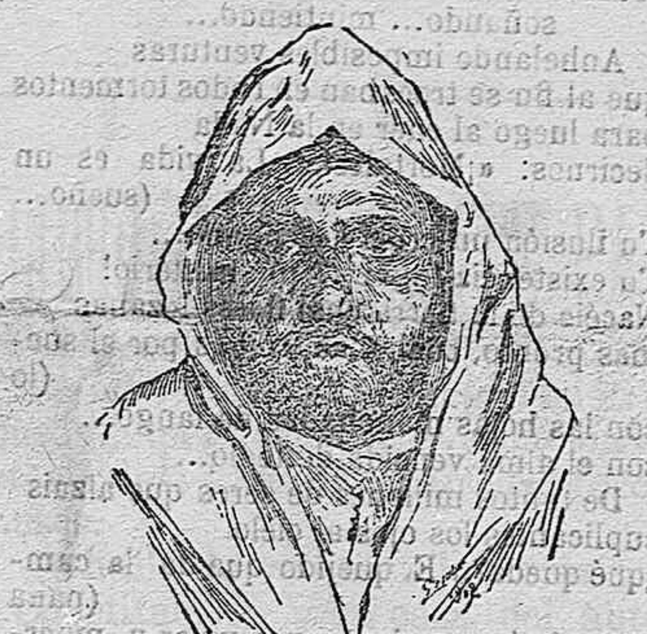
Muley Haffid, cuya abdicación es en la actualidad la nota más importante en el mundo político

de cal para construcción, sitos junto á fuerte de San Cristóbal, el fabricante José Bolin, pone á disposición del público referido material, de primera clase, al precio de 16,50 pesetas metro cúbico.