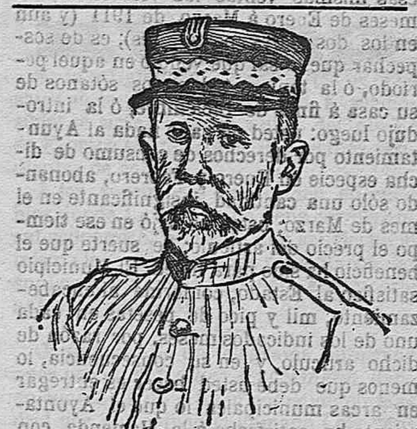
El general Larrea, jefe de una de las divisiones del Ejército de operaciones de Melilla.