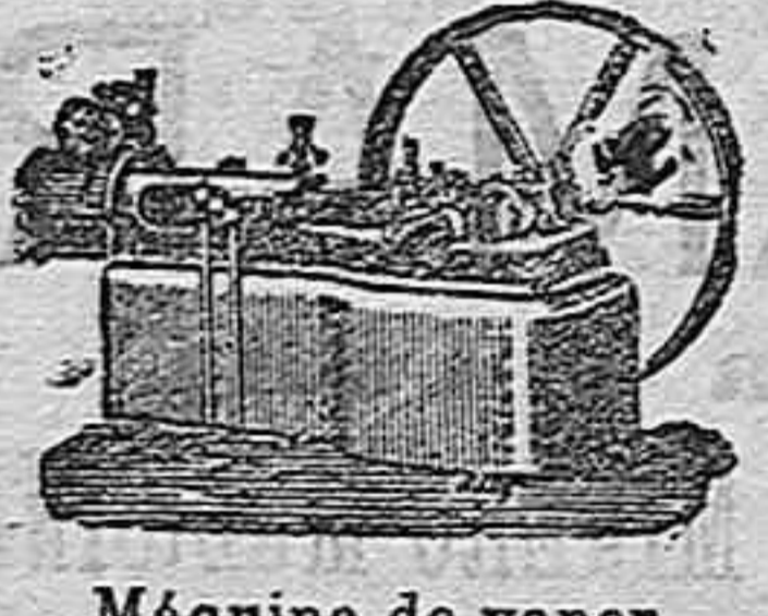
Máquina de vapor horizontal.