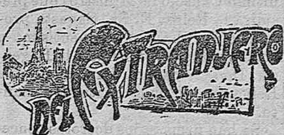
Desde París: Duración media de la vida en Francia.