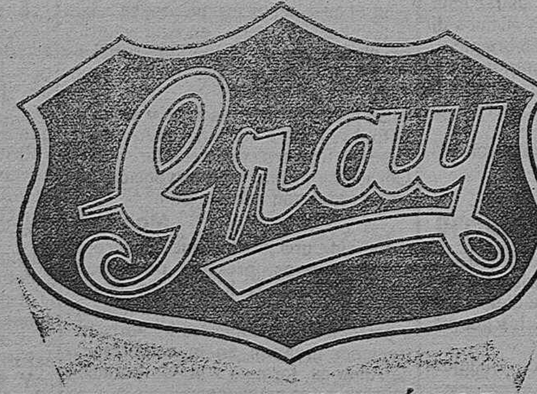
EL COCHE ECONÓMICO

El presidente de esta Audiencia territorial desmintió hoy la noticia publicada de sustituciones a consecuencia de la inspección de Tribunales realizada por el magistrado señor Avelló.