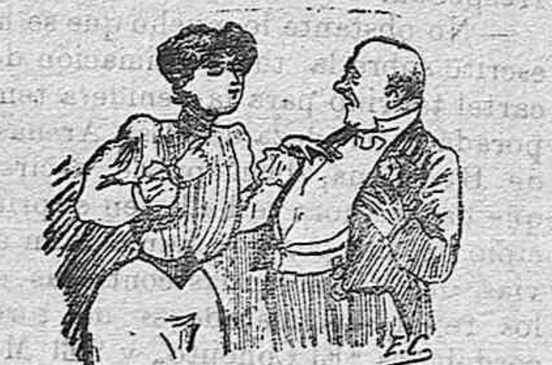
Adivinar un número.

Después de proponer a una perso- na que piense un número cualquiera se le dice que lo duplique, que agre- gue un 4 y que multiplique el total por 5; que añada 12 al producto y se multiplique el total por 10; después se restan de este total 320 y de la cantidad que queda, separando las dos últimas cifras, las que preceden a las separadas dan el número pen- sado.