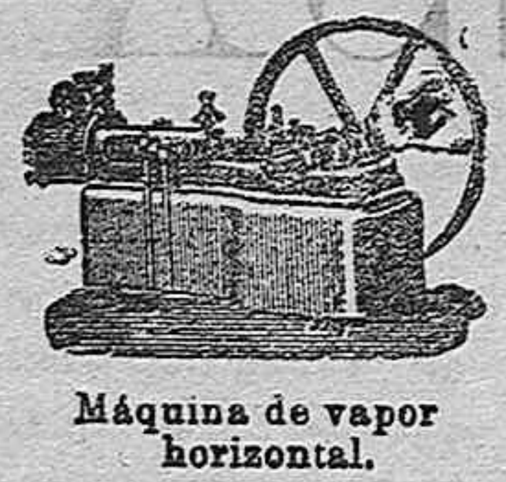
Máquina de vapor horizontal.

DESPACHO: Alcalá, 52. DEPÓSITO: Claudio Coello, 53 SUCURRAL: Campo Grande, Letra E. Valladolid. Madrid.