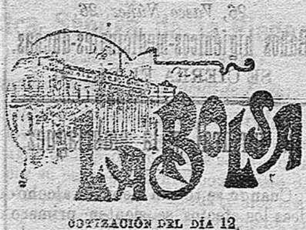
COTIZACIÓN DEL DÍA 12.

(Remitido por D. José Congosto, Cónsul de España en Burdeos).