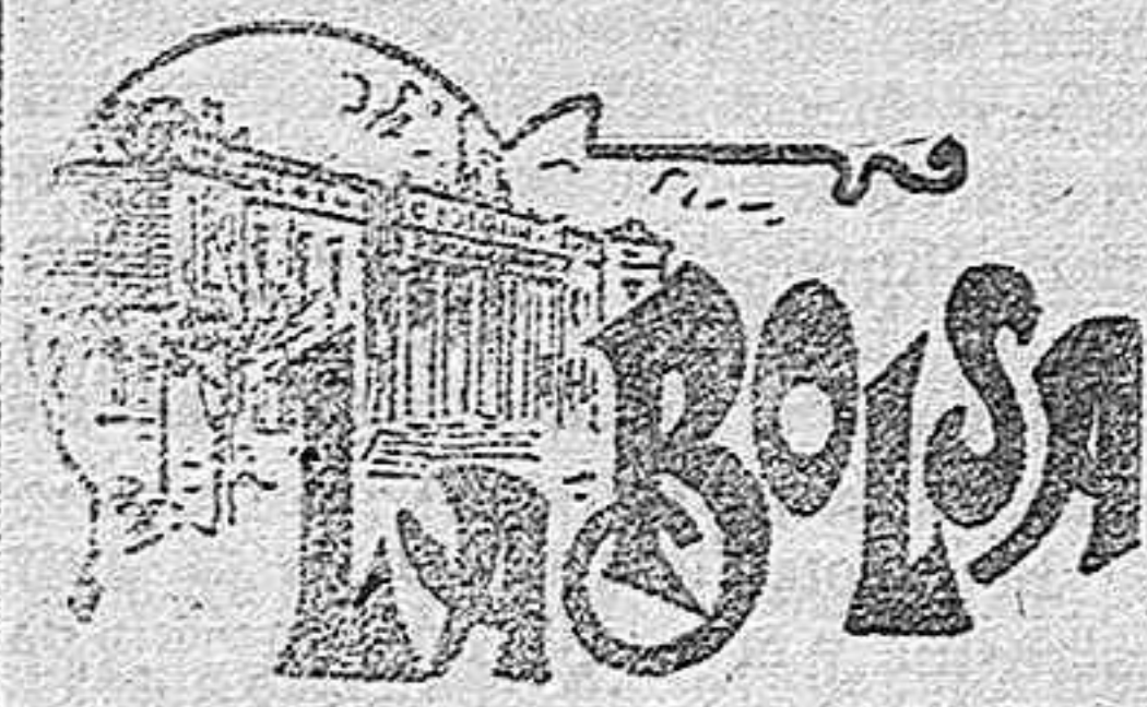
COTIZACIÓN DEL DÍA 17.