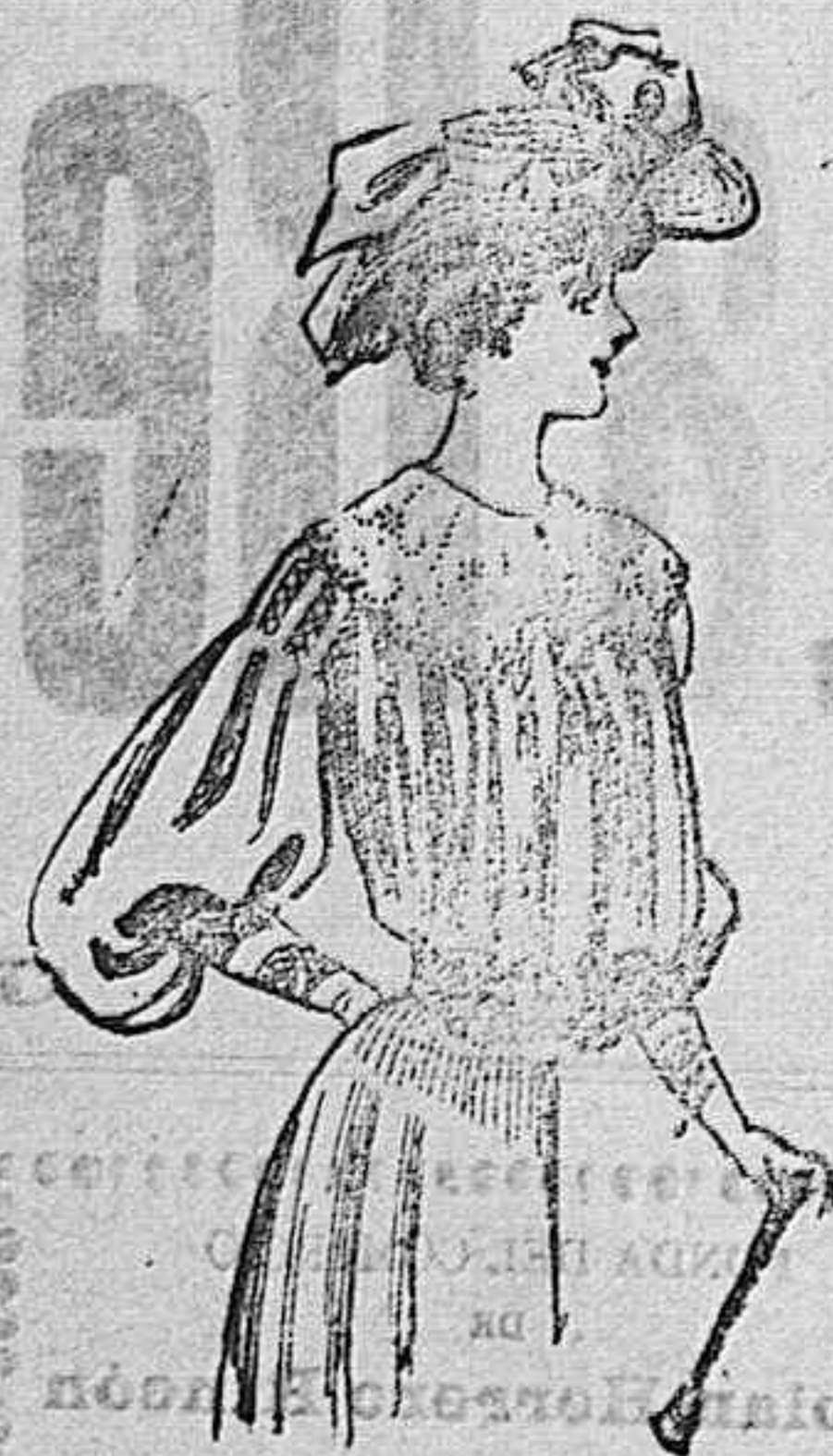
Traje para playa

De piqué azul. Cuerpo formando bolearo en el delantero, con calados en el escote y parte superior de la manga. Cuello, puño y cinturón de tela blanca con bordado inglés.