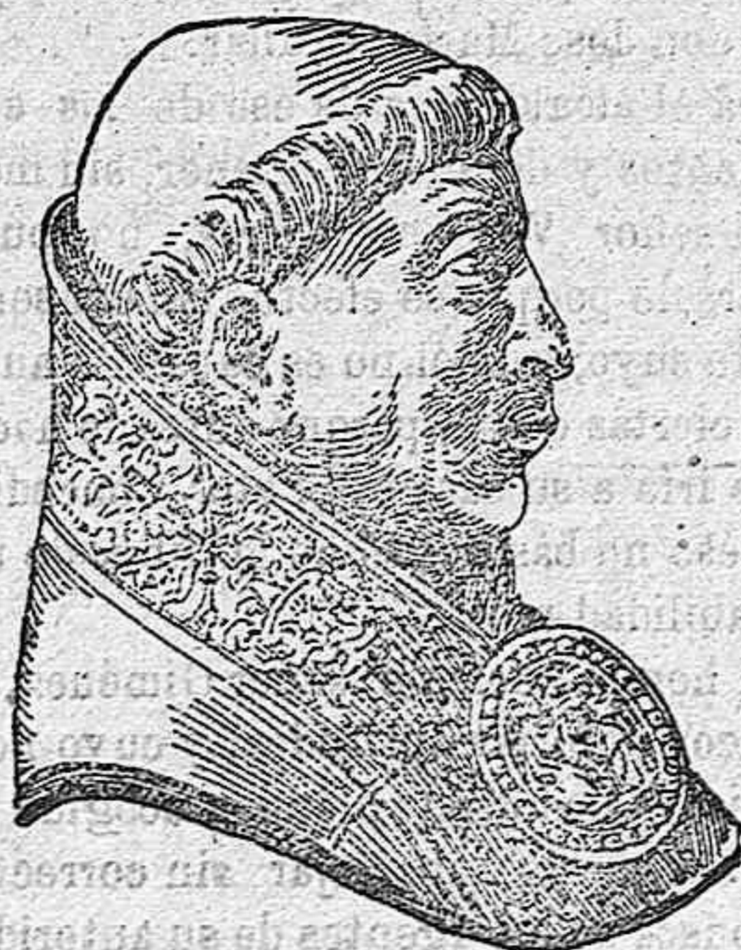
El cardenal JIMÉNEZ DE CISNEROS