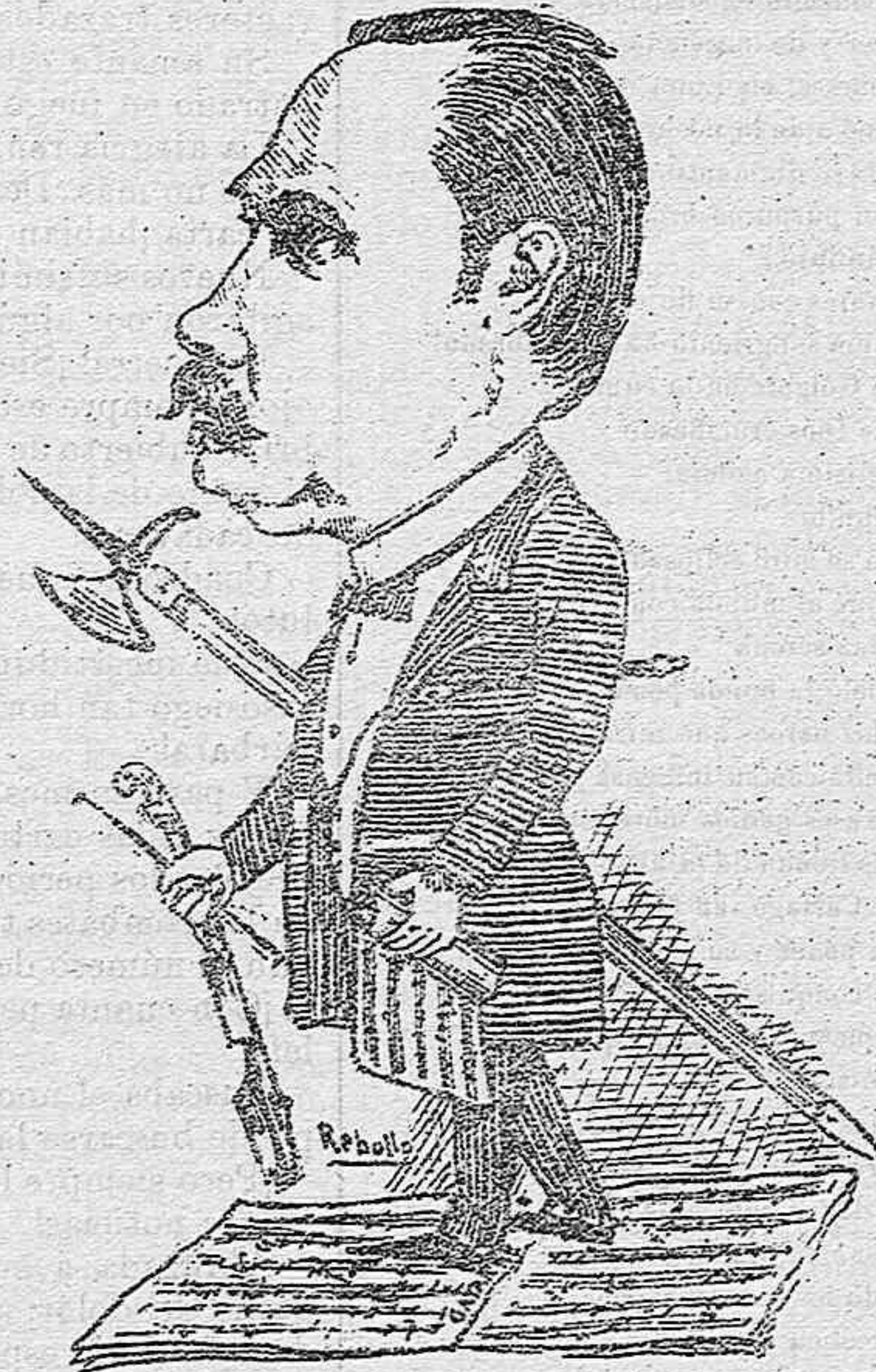
Ha dirigido la banda del cuerpo de Alabarderos; es un buen compositor y un excelente maestro.

de nuestro corazón tristes sentimientos que al llegar á nuestro cerebro hacen mover nuestros labios para salir de ellos estas palabras: ¡Desgraciada España!