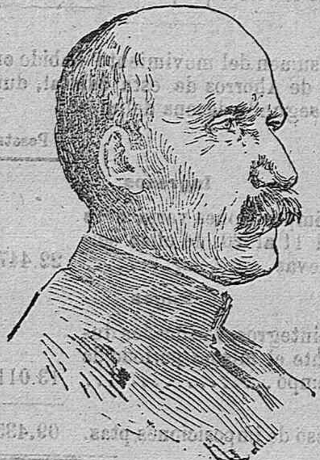
General Petain, que por sus éxitos como general en jefe en la actual ofensiva en el frente de Verdún, le ha sido concedida la Cruz de la Legión de Honor, con señalada citación.