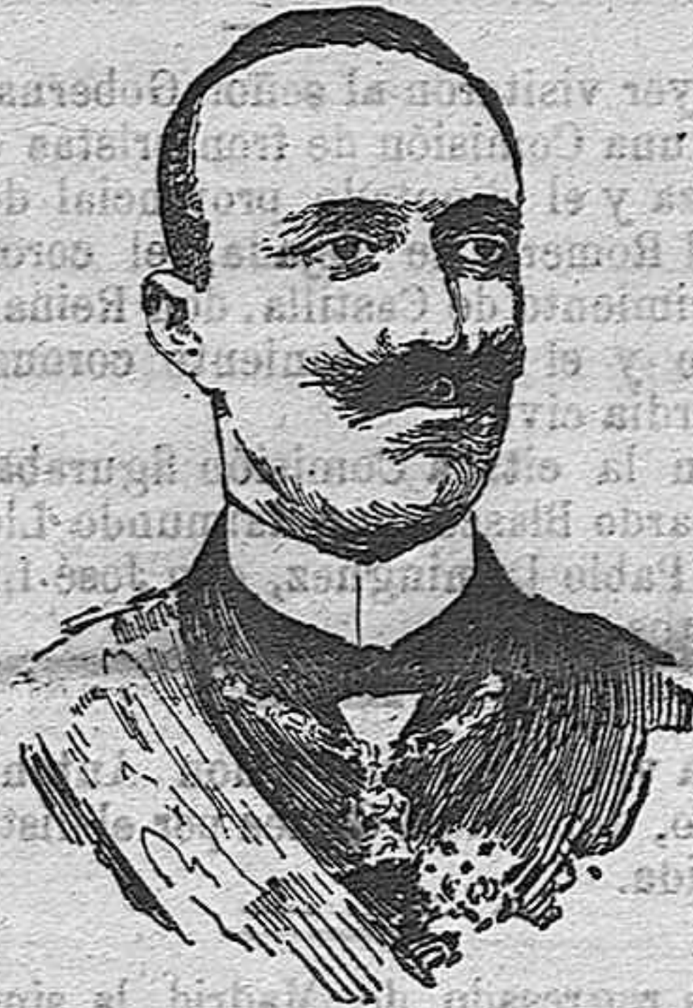
EL PRINCIPE DE ULINA,

hijo del duque de Génova, jefe de la Misión italiana que se halla en los Estados Unidos.