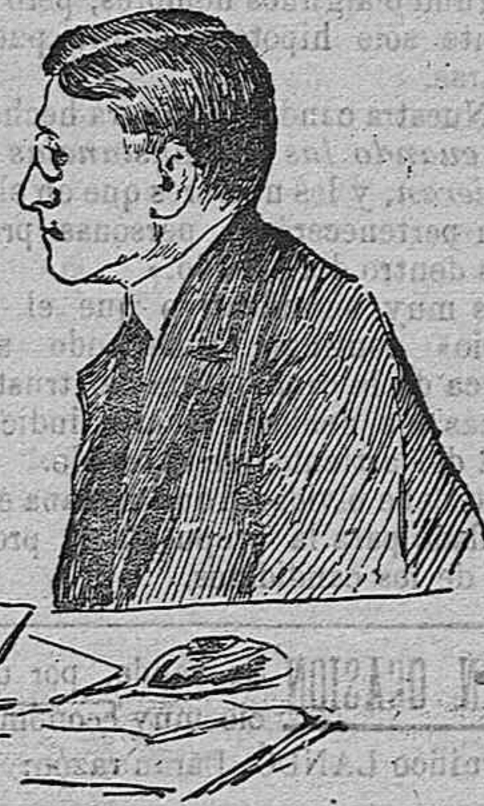
GENERAL HUGH L. SCOTT

jefe del Estado Mayor del Ejército norteamericano.