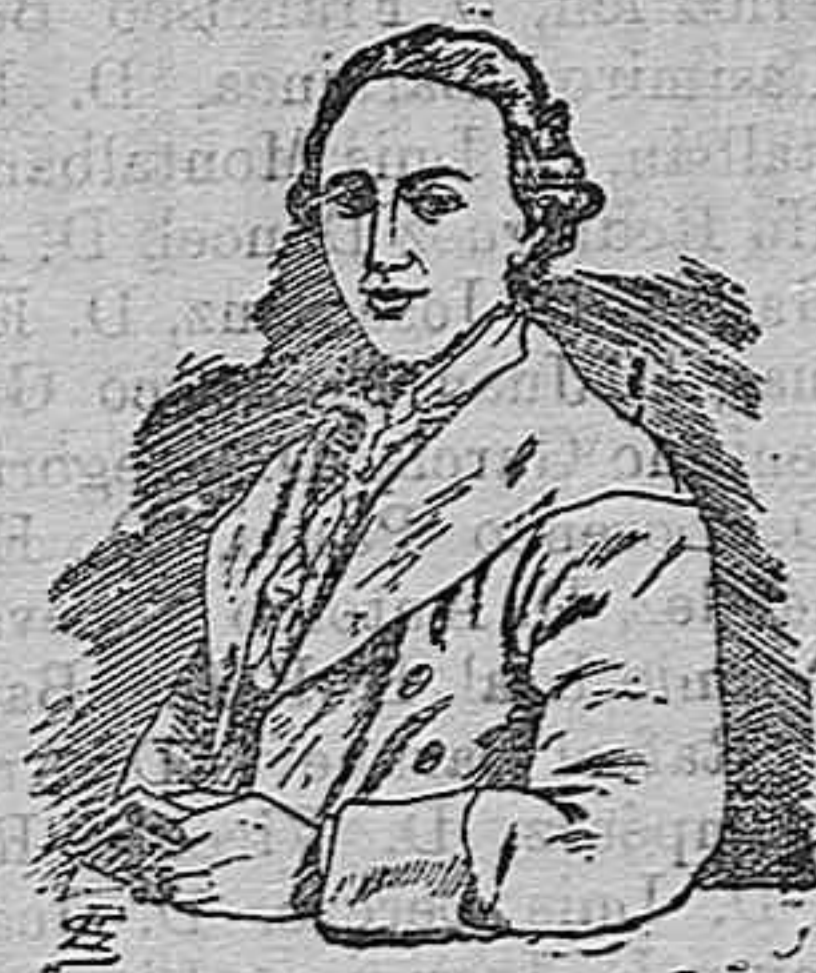
D. José Nicolás de Azara.

Nació en Barbuñales (Huesca) el 3 de Diciembre de 1730—† en París en 26 de Enero de 1804.