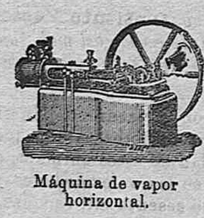
Máquina de vapor horizontal.