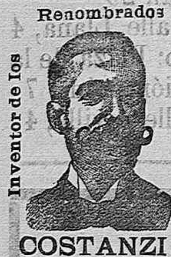
Inventor de los medicamentos Renombrados

Indisputable superioridad en Cafés molidos y en grano TÉS, TAPIOCAS.