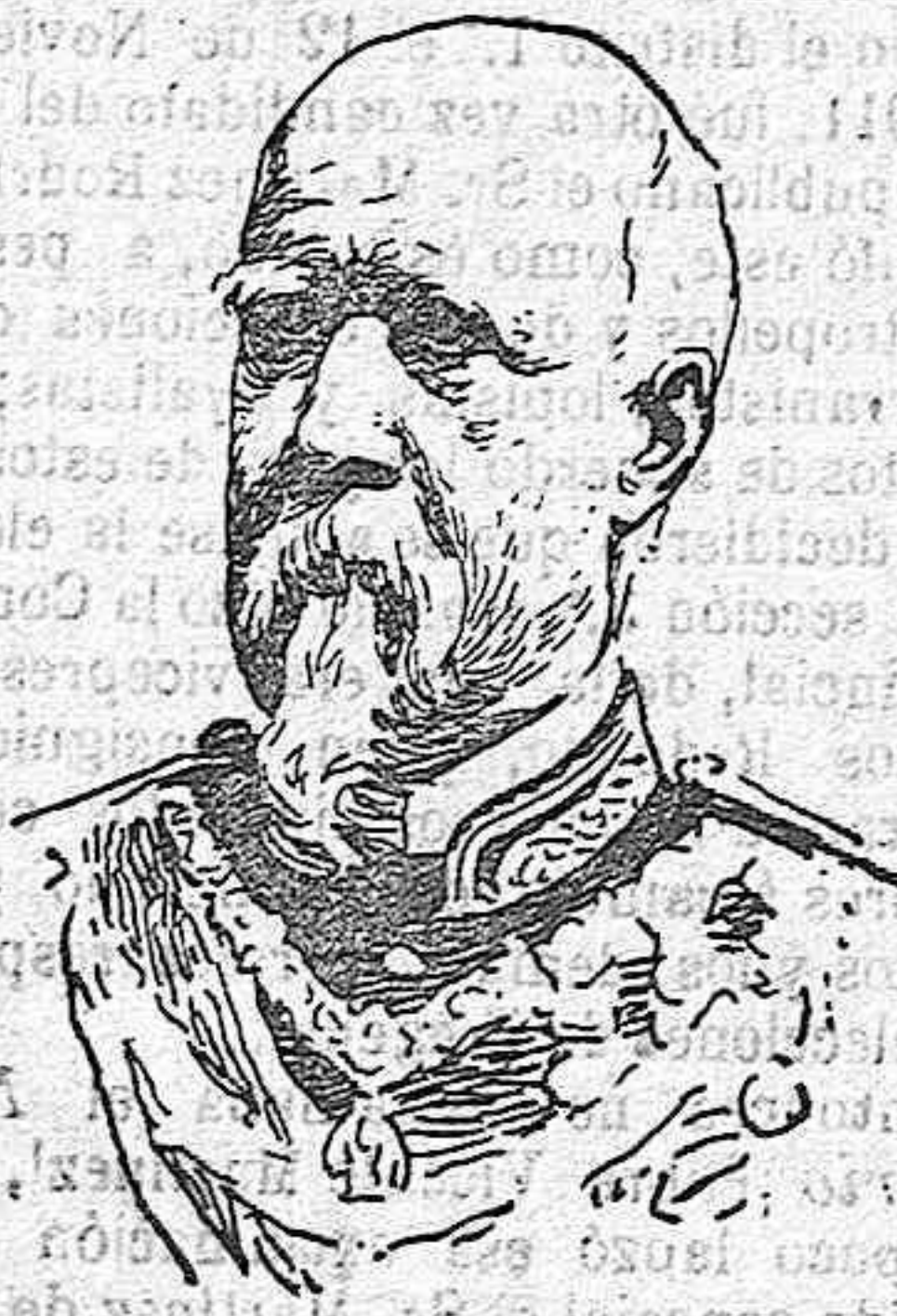
El general D. Marcelo de Azcárraga, designado por el Gobierno para la presidencia del Senado.